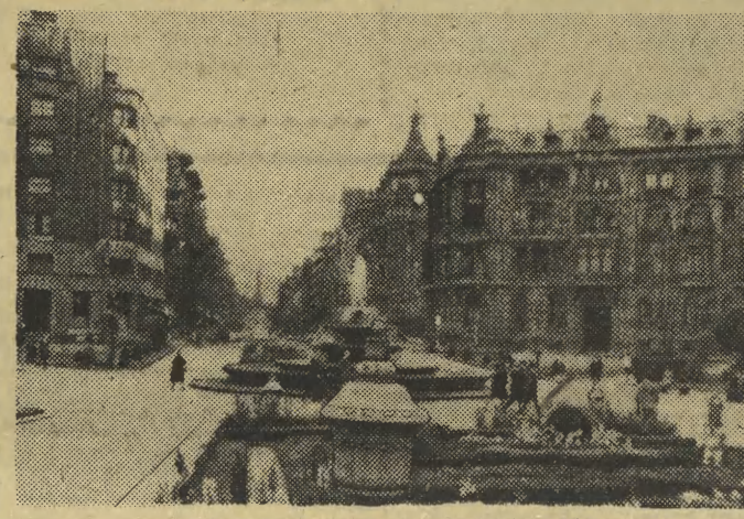
BILBAO. Plaza de Federico Moyua