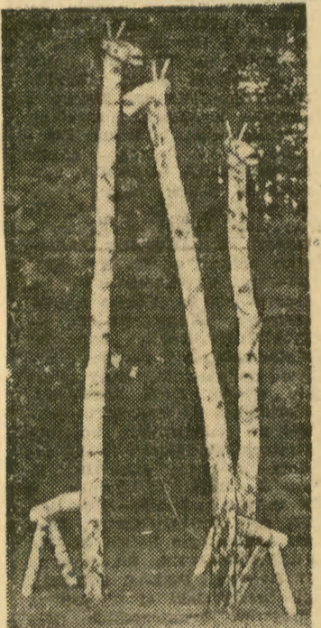
Bardzo efektywnie wyglądają trzy brzożowe żyrafy w nowo otwartym parku na Woli Justowskiej. Oto one w całej królestwie.

JUTRO O GODZINIE: * 11 — ul. Skarbowa 4, sala 410 — w związku z ekspozycją w gmachu Zw. Zaw. wystawą „Człowiek a praca” — prelekcja mgr inż. Cz. Puzyna pt. „Człowiek w środowisku hałasu”. * 19 — KDK — odczyt dr Wł. Marcinkowskiego „O wspólnej od-