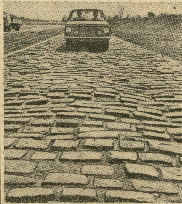
— Młła takiej drogi równa się podobno 100 młm dobrej autostrady, niemniej każdy nowy wóz opuszczający angielskie fabryki musi być poddany i takim testom. Najdłuższy odcinek próbnej tego rodzaju szosy znajduje się w Warwickshire i liczy prawie 3 km. Jest urozmaicony zakrętami w kształcie litery „S”. (db)