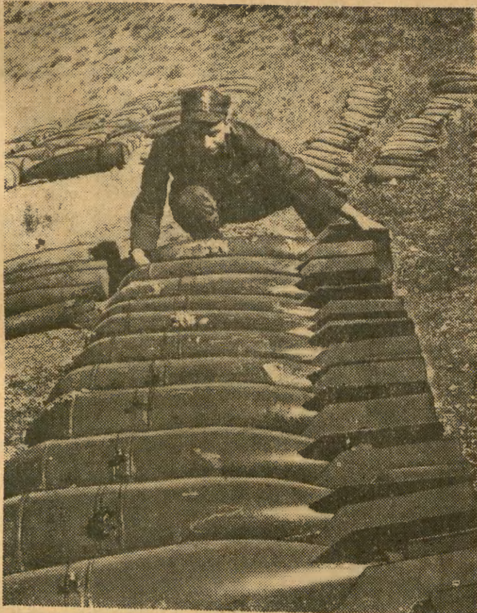
25 lat mija od wybuchu wojny, 20 lat — od jej zakończenia, a wciąż jeszcze straszą i grożą jej pozostałości. W lasach i na polach, w wykopach pod fundamenty nowych domów znajduje się magazyny śmiercionośnej broni. Na zdjęciu układanie bomb lotniczych do wysadzenia, znalezionych niedawno na terenie Warszawy. CAF