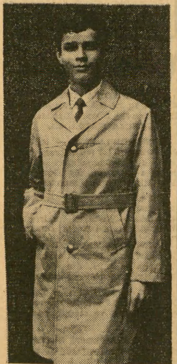
Model młodzieżowej kolekcji Mody Polskiej — klasyczny płaszcz popielinowy na pod-siniec w kratę. Karczki, klapy, pasek i dół odstępnowane, zapinanie na trzy złote guziki.

Stacje Radiowe i Telewizyjne w Krakowie poinformowały nas, że program III-ci nadawany na falach ultrakrótkich można będzie odbierać tylko odbiornikami posiadającymi ten zakres fal. Skale odbiorników dla zakresu UKF wycochowane są w megahercach, a nie w długościach fali, i stąd podawanie długości fal dla tych stacji byłoby bezcelowe. (S)