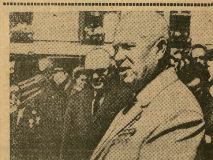
Premier Nikita Chruszczow przemawia 29 sierpnia w Bańskiej Bystrzycy na uroczystościach związanych z 20 rocznicą powstania słowackiego.

Na każde 3 segmenty mieszkaniowego giganta przypadnie 1 zespół wind, zawierający 3 windy osobowe i 1 towarowo-osobową. W podziemiach zbudowany będzie garaż na 270 samochodów a w parterowej części — samobsługowa pralnia mechaniczna. W bezpośrednim sąsiedztwie budynku, na obszarze 3 ha, powstaną zieleńce.