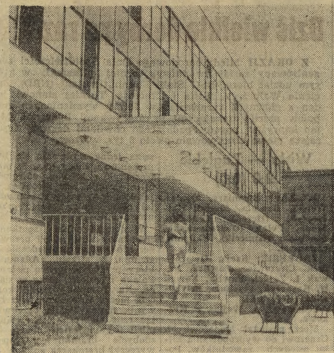
W wyższych uczelniach cicho i spokojnie — wakacje. Pusto również na terenach Akademii Górniczo-Hutniczej, czasem tylko ktoś spieszy do biblioteki...