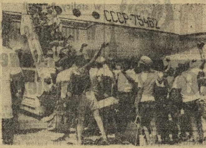
Towarzystwo Przyjaźni Radziecko-Włoskiej zaprosiło na miesięczny pobyt na wybrzeżu Morza Czarnego 70 dzieci — ofiar styczeńowego trzęsienia ziemi na Sycylii. Na zdjęciu: odlatujące 25 km. z Sycylii dzieci żegnają się z rodzicami.

Tegoroczna impreza odbywająca się w 25-lecie Wojska Polskiego, wykorzystana zostanie do upowszechnienia inicjatywy „Praktyczny turystyczny szlak sportowy, związanej z społeczną budową schroniska im. W. Lenina na Markowych Szczawinach pod Babią Górą.