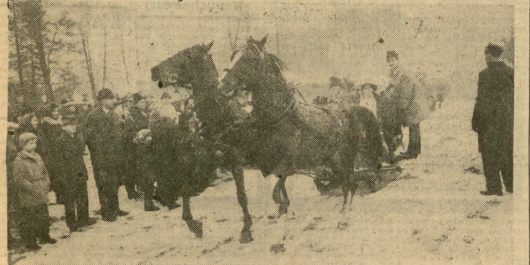
Korowód sań mknie z Michałowie na spotkanie kuligu z Woli Więclawskiej, by na „udeptanej” ziemi zaprezentować w zmaganiach turniejowych mieszkańców obu wsi folklor i umiejętności ludzi tego rejonu pow. krakowskiego.

SIC TRANSIT... „Życie jest żniwiarką iluzji”. Pisarz francuski — Jean Genet Zebral (jas)