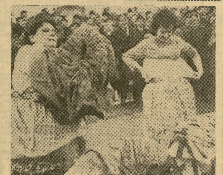
Prawdziwy pokaz zręczności dały mieszkanki Michałowic i Woli Więclawskiej, popisując się szybkim wdzianianiem kilkunastu spódnic, nie mówiąc już o tym, że przy tej okazji śmiechu było co nie miara.

Wygrały ostatecznie Michałowice różnicą jednego punktu, ale przecież nie w tym rzecz. Chociaż wszystko czyniono pół serio pół żartem, jasne było, że ludność obu wsi długo przygotowywała się, by móc pokazać miejscowy folklor i własne umiejętności. Ten zapal i inicjatywa wniosły liczące się wartości, niezależnie od przepysznej zabawy, urządzonej ze szczerego serca. (mal)