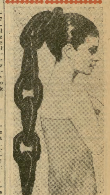
Znany fryzjer paryski — Jacques Dessanges każe wyciemnionym kobietom znów zakazać się w kajdany. Szczesliwie będzie to modne tylko wiosną i latem 1969.

W ośrodku hodowli żubrów w Puszczy Boreckiej w woj. olsztyńskim, żyje ok. 30 tych cennych zwierząt. Żubry pochodzą z gatunku górskiego kaukaskiego. Ostatnio przygotowuje się ich „przeprowadzkę” w Bieszczady, gdzie zostaną wypuszczone na wolność.