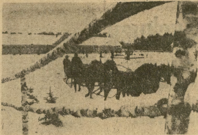
To dopiero zabawa! Lekkie sanie zaprzężone w czwórke ognistych trzylatków z Państwowego Stada Ogierów w Białym Borze.

Dyrekcja i Rada Zakładowa MHD Art. Spożywczy „Wschód” w Krakowie oraz koleżanki i koledzy