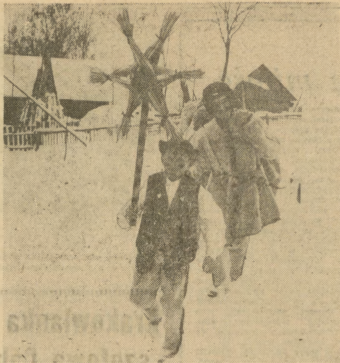
HEJ KOŁĘDA, KOŁĘDA