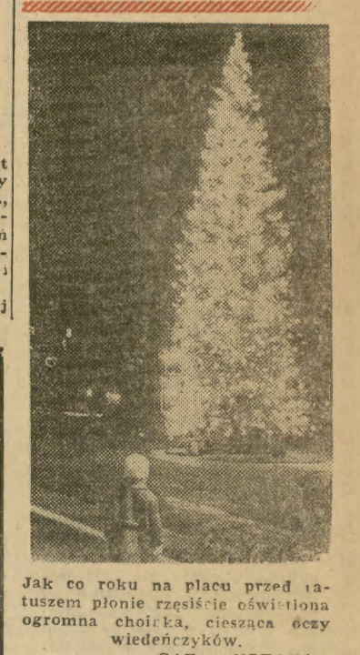
Jak co roku na placu przed ratuszem plonie rzeźbienie oświetlona ogromna choinka, ciesząca oczy wiedeńczyków.

Stacja sejsmograficzna w Rockland (Maryland) podała, że 25 bm. silne trzęsienie ziemi nawiedziło wschodnią część Morza Karaibskiego. Wstrząsy wywołały panikę wśród ludności wysp. Nie ma doniesień o ofiarach w ludziach.