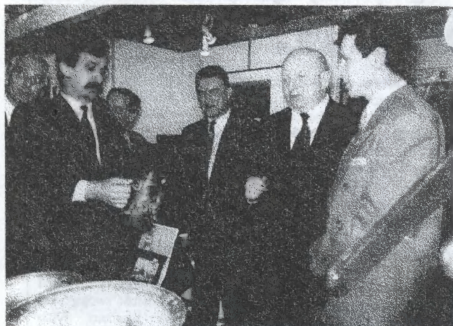
Premier J. Oleksy na stoisku Olkusza

Oferta terenowa naszego miasta także zainteresowała wielu zwiedzających, jednak na efekty trzeba będzie jeszcze poczekać.