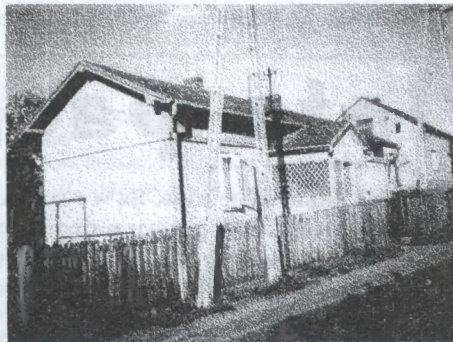
Dom przy ulicy Jasnej w Olkusz