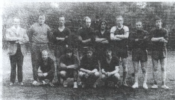
Drużyna Wydziału Reontowego