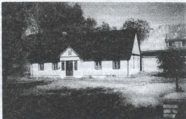
Dawna celnica w Rabsztynie