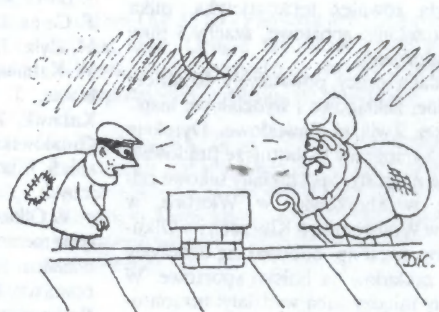
...i na dachu.