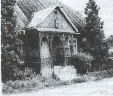
Ciekawy ganek domu w Pilicy