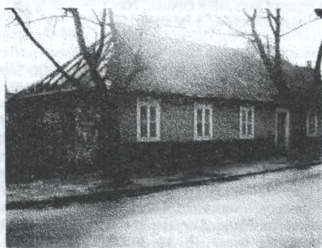
Nieistniejący dom przy ulicy Górniczej

W Olkuszu, w kwietniu tego roku, przy ul. Górniczej rozebrano jeden z ostatnich pochodzących z połowy XIX w. drewnianych domów. Przez pewien czas była nadzieja, że trafi on do skansenu w Wygiełzowie, ale nic z tych zamierzeń nie wyszło, pewnie z braku pieniędzy. Miejskiemu konserwatorowi zabytków udało się jednak przekonać właściciela terenu, by ten wybudował w tym miejscu dom o podobnej konstrukcji, z zachowaniem niektórych elementów zabytkowego pierwowzoru. I taki dom powstaje. Ciekawy architektonicznie, choć w fatalnym stanie technicznym, jest drewniany XIX w. dom stojący naprzeciw tzw. ruskiego targu. Zwraca uwagę zwłaszcza piękna stolarka okienna. Niestety dni tego domu też są policzone, gdyż nie nadaje się on już do remontu. Kilka drewnianych domów ostało się jeszcze w dzielnicy Piaski i na Mazańcu, obok dworca PKP oraz przy ul. ul. Słowackiego, Nowej, Jasnej. Przy ulicy Wiejskiej stoi jeszcze kilka drewnianych domów (np. nr. 9, 13, 15). Najpiękniejszy z nich to nr 15, pomalowany na żółty kolor, charakteryzuje się wspaniałym gankiem i misterną stolarką okienną. Wspaniałą oprawę dla domu stanowią rosnące przed