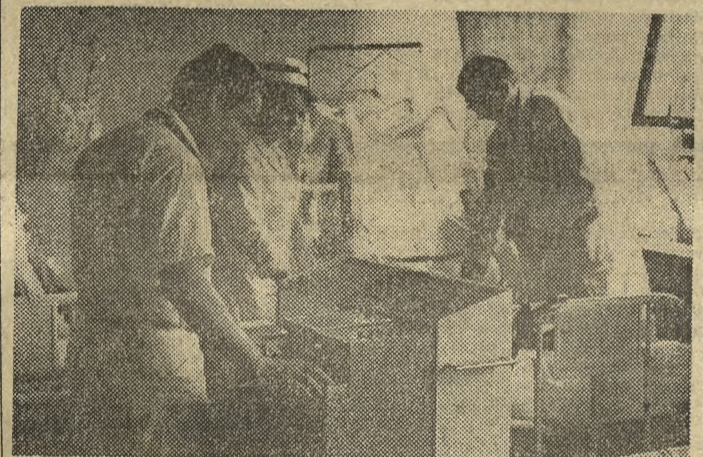
Aparatura reanimacyjna zainstalowana przy łóżku chorego w Klinice Chorób Zawodowych AM w Hucie im. Lenina w Krakowie.