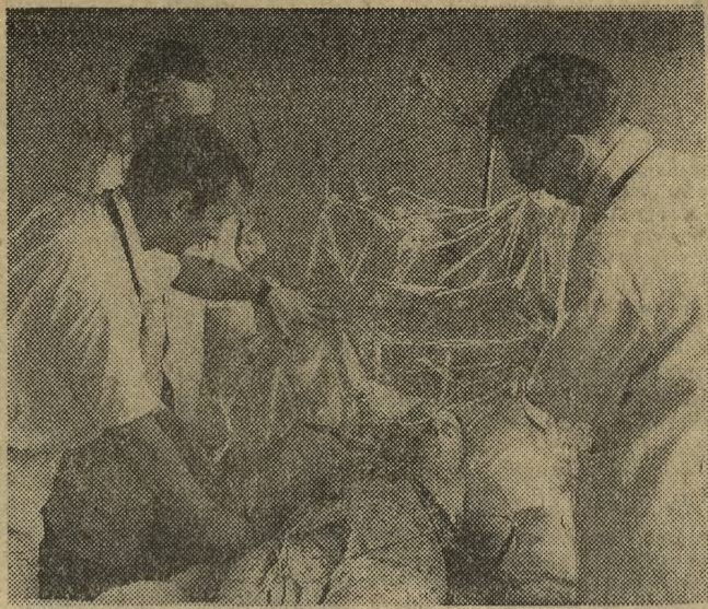
Instalowanie namiotu tlenowego nad chorym w Klinice Chorób Zawodowych w Hucie im. Lenina.

Wreszcie — inwestycje. Gdy w latach 1966—70 resort zdrowia dążył przede wszystkim (oczywiście w miarę swych skromnych możliwości) do rozwoju w poszczególnych dzielnicach placówek lecznictwa otwartego, to projekt planu na lata 1971—75 przewiduje w pierwszym rzędzie rozbudowę sieci żłobków, niezbędnych zwłaszcza w nowych osiedlach mieszkaniowych. (lov)