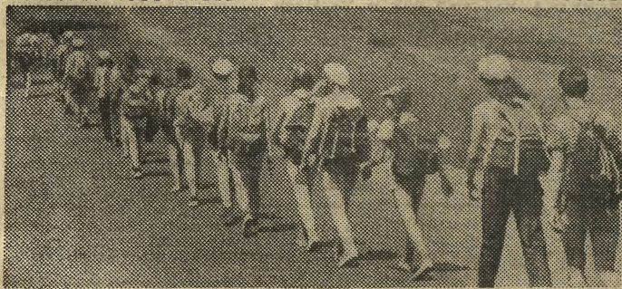
Nie wszyscy niegłi jeszcze bakcyliowi motoryzacji. Na zdjęciu: młodzież szkolna na obozie wędrownym w Kotlinie Kłodzkiej.

Środki obrotowe — przeważnie środki produkcji, które w trakcie produkcji całkowicie się zużywają i przechodzą w skład produktu. Są to: 1. surowce, materiały pomocnicze, produkcja w toku, zapasy wyrobów gotowych, opakowania. 2. niezbędne do kontynuowania produkcji środki pieniężne, w tym sumy przeznaczone na płace. 3. przedmioty nietrawale.