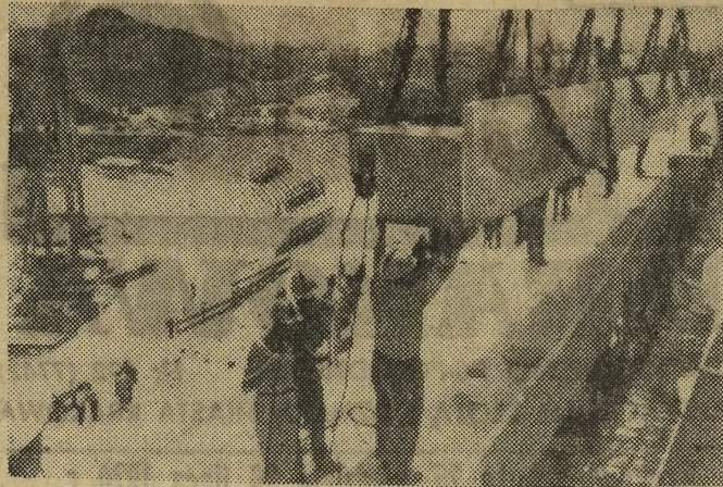
W Monachium, gdzie w 1972 r. odbędą się najbliższe Igrzyska Olimpijskie, zakończona została budowa stadionu. Robotnicy układają właśnie przybrany girlandami ostatni element nowego obiektu.