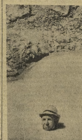
Sposób na upały

Obok statków — zwłaszcza wielkich zbiornikowców, samochodów, motocykli i tranzystorowych odbiorników radiowych i telewizyjnych — Japonia wchodzi na światowy rynek z nowym wyrobem. Są to domowe kuchnie mikrofalowe. W bieżącym roku Japonia zamierza wyeksportować ponad pół miliona takich urządzeń — głównie na rynek północnoamerykański. (WIT-AR)