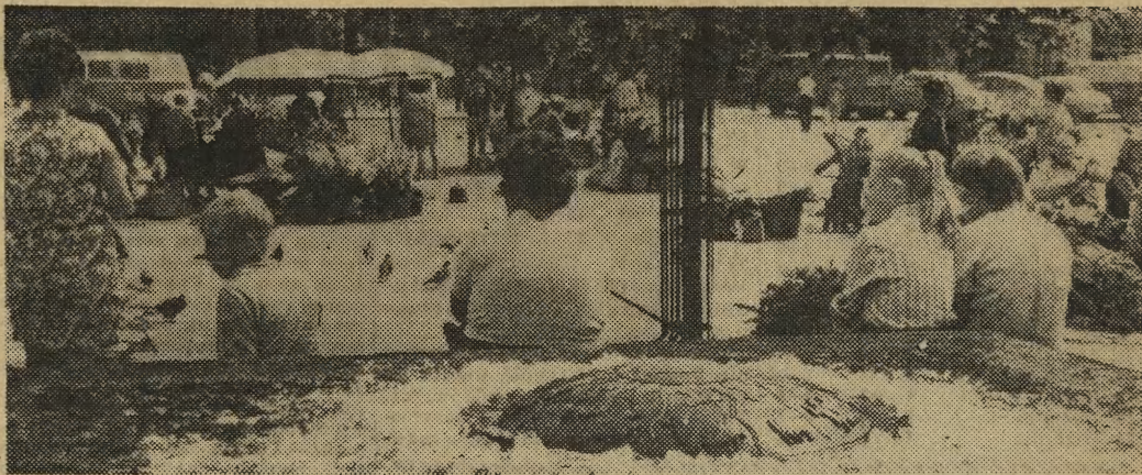
W oczekiwaniu na hejnał mariacki...

stęp jest widoczny, chociaż nadal przestrzeganie higieny wydaje się być dla zatrudnionych w gastronomii pracowników czynnością czysto „sprawozdawczą”. Świadczy o tym chociażby popłoch, gdy przyszło do sprawdzania przepisowych nakryć głowy, hańdż czystych fartuchów, które naprędce zmieniano po kątach. „Pokaż mi swą kuchnię a powiem ci kim jesteś” — tę zasadę powinni stosować częściej kierownicy i personel zakładów gastronomicznych, bo chociaż konsument nie ma wstępu do pomieszczeń produkcyjnych i nie ma zwyczaju zaglądać do kuchennego kotła, to wcześniej czy później wpadnie miandrat lub spisek protokołu... a przecież nie o to nam wszystkim chodzi. (J)