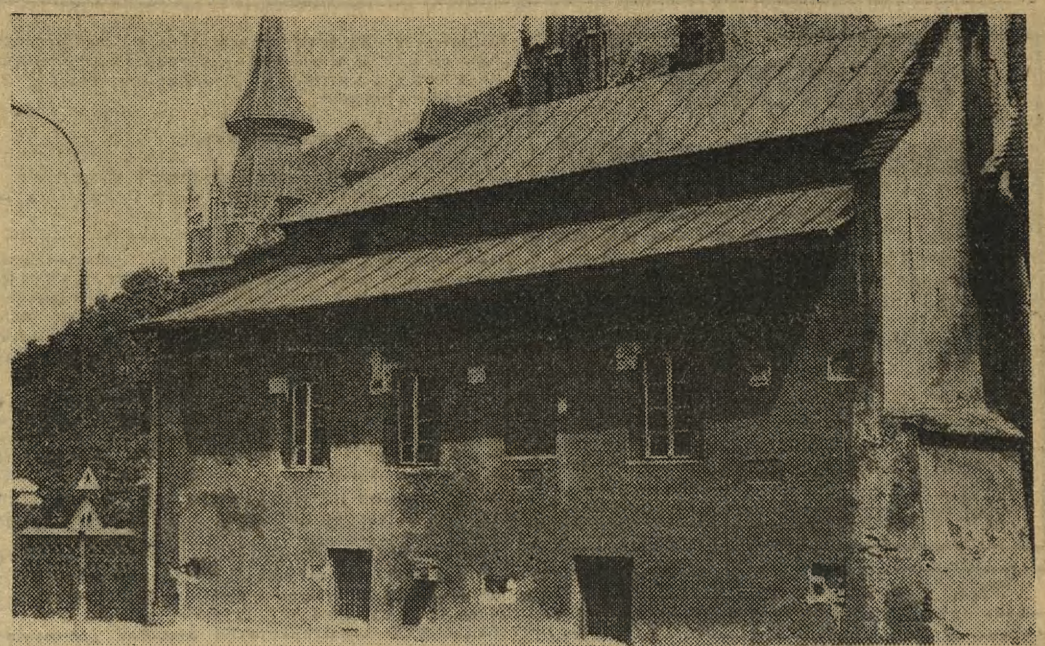
Historyczna kamienica kapitulna na rogu Kanoniczej i Podzamcza w Krakowie, w której Długosz pisał swą Kronikę i uczył dzieci Kazimierza Jagiellończyka, zamieszkiwana była na przestrzeni wieków wyłącznie przez ludzi znaniych, najwyższych urzędników państwowych, znakomitych pisarzy i humanistów. Tu także, w dużej sklepionej izbie parterowej, miał pracownię rzeźbiarz Franciszek Wyspiański, ojciec Stanisława, który spędził tu swe lata chłopięce. W początkach XVI w. dom uległ przekształceniu w duchu renesansu. Z tych czasów pochodzi kamienny gzyms nad bramą z napisem łacińskim „Nie ma w człowieku nic lepszego ponad dobrą myśl”. PKZ w czasie generalnego remontu przeprowadzą korektę wnętrza, likwidację ścian działowych z XIX i XX w. W tylnych oficynach otworzy się zamurowane otwory okienne, zrekonstruuje pierwotne wejście na ganek, odstani całkowicie arkadę renesansową między klatką schodową a sienią wjazdową, oraz wyeksponuje odkryte detale architektoniczne. Na podwórku otworzy się dawny bruk, zaznaczając na nim bieg muru obronnego kamieniem o innej fakturze.

Jak wynika z badań specjalistów, urazy czaszkowo-mózgowe są najczęściej bezpośrednią przyczyną zgonów. Często też nawet po wyleczeniu, w rezultacie uszkodzenia pnia mózgu i zachwiania centralnego organu kierowniczego ustroju, pacjenci stają się inwalidami i tracą zdolność do pracy. Np. w NRF blisko 90 proc. osób po przebytych urazach głowy i mózgu nie może pracować. W Wielkopolsce, jak wynika ze statystyk, 80 proc. poszkodowanych wskutek wypadków drogowych stanowią mężczyźni w wieku produkcyjnym. Statystyki światowe nie zostawiają najmniejszych złudzeń, że wypad-