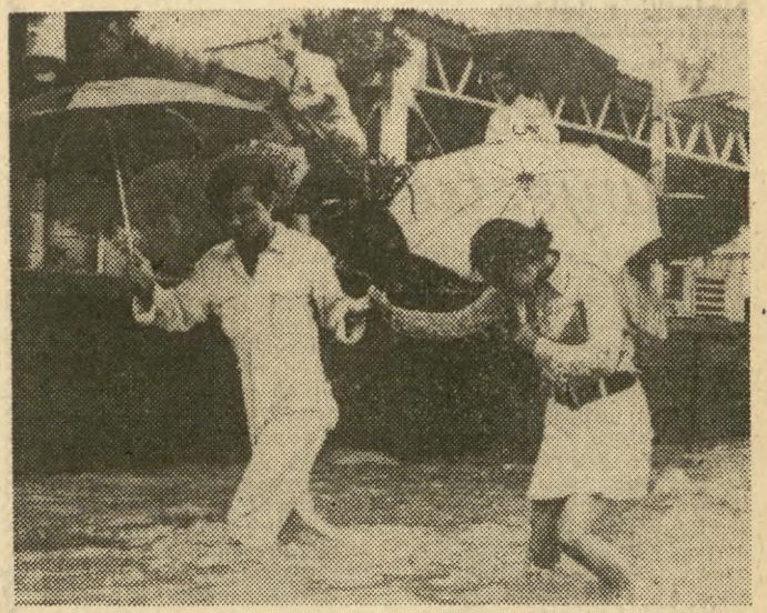
WE DWOJE — RAŻNIEJ... ...nawet brnąć przez zalane wodą ulice Nagoya po ostatnich ulewnych deszczach...