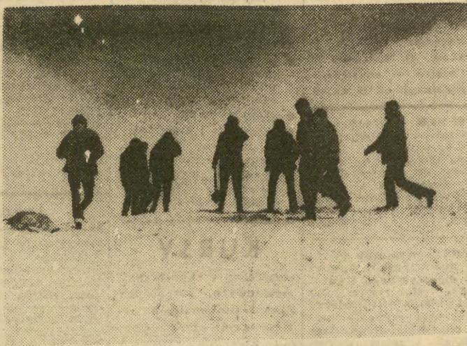
Wrześniowłi wczasowicze na szczycie Kasprowego Wierchu.

Dażność do obniżania dolnej granicy wieku szkolnego obserwować można w wielu krajach. Na Węgrzech, w NRD, w Bułgarii i wielu krajach zachodnich, rozpoczynanie nauki w 6 roku życia jest już tradycją. W Anglii nawet od 5 roku. Skoro mogą tamte dzieci, może mogą i nasze? A co o tym sądzą rodzice? Czekamy na wypowiedź.