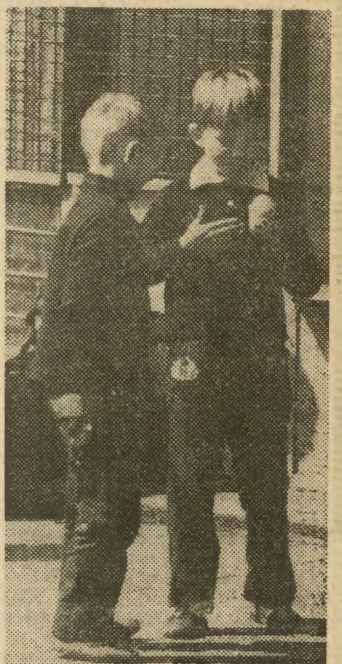
Smakują o każdej porze roku.

W niedzielę koncert orkiestry Filharmonii Narodowej pod dyrekcją A. Markowskiego zakończy XV Międzynarodowy Festiwal Muzyki Współczesnej „Warszawska Jesień”.