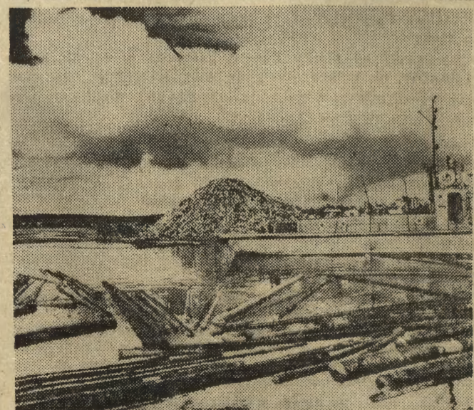
Kombinat celulozowo-papierniczy im. Klrowa w Kondopodze nad Jeziorem Onega w płn.-zach. części Rosyjskiej FSRR, zatrudniający około 4 tysięcy osób, produkuje rocznie 380.000 ton papieru. Ponad 35.000 ton papieru eksportowane jest do NRD. Na zdjęciu: drewno splawiane jeziorem do kombinatu czeka na wydobycie.

W Niemieckiej Republice Federalnej opatentowano technologię wytwarzania tzw. folii „oddychających”. Jest to zazwyczaj folia z PCW poddana działaniu promieni np. laserowych, w której pod wpływem ich działania tworzą się mikroskopijne otworki, ułatwiające przenikanie pary wodnej i gazów. Folie te znajdują zastosowanie w produkcji opakowań do wędlin.