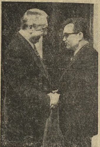
Wczoraj w Warszawie I sekretarz KC PZPR Edward Gierek przyjął, przebywającego z oficjalną wizytą w Polsce, przewodniczącego Rady Ministrów Ludowej Republiki Bułgarii — Stanko Todorowa. N.z.: E. Gierek wita S. Todorowa w siedzibie Komitetu Centralnego.

sunków, współdziałania na rzecz umacniania pokoju, bezpieczeństwa i współpracy w Europie i na całym świecie.