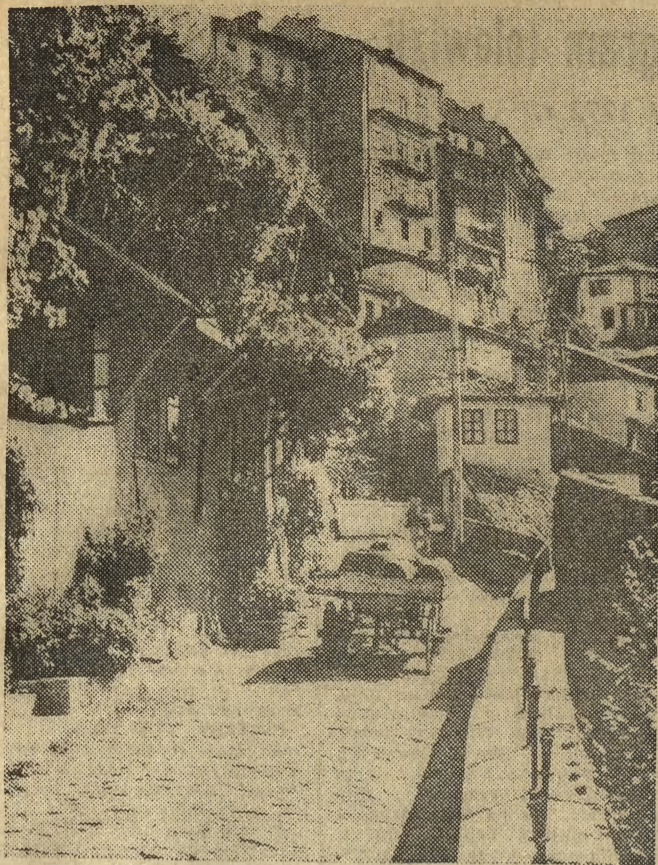
Zaułek w Tyrnowie.