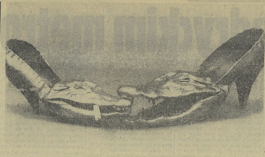
Oto jeszcze jedna para pantofli niezupełnie na codzienny użytek ... Były one eksponatem na wystawie w Muzeum Sztuki Współczesnej w Nowym Jorku.

Gdy pracuje się w zamkniętych pomieszczeniach co pewien czas należy stosować tzw. oddych „orzeźwiający”. Mianowicie: wciągać powietrze przez nos, zatrzymać kilka sekund i dopiero powoli powietrze wypuścić. Czynność tę najlepiej jest wykonywać stojąc i podnosząc ręce do góry.