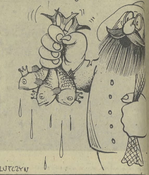
Rys. E. LUTCZYŃ