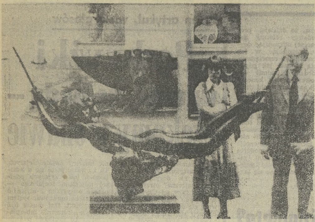
„Naga dziewczyna na hamaku” (brąz) londyńskiego rzeźbiarza Sydneya Harpleya — na dorocznej wystawie sztuki w Royal Academy.