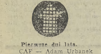
Pierwsze dni lata.

Likwidację kolejek leśnych odczuwają głównie tartaki i inne zakłady przemysłu drzewnego. Nie kursują już kolejki po obszarach leśnych w Górach Świętokrzyskich, pozostała jedynie trasa w Puszczy Kozienickiej, którą przewozi się drewno do tartaku w Pionkach.