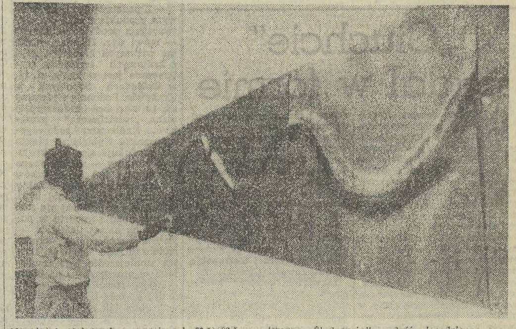
160 płytek stalowych o wymiarach 62,5x62,5 cm tworzy „Ślad weża” — dość niecodzienna praca rzeźbiarza Friedricha Warthmauna (na zdjęciu), pokazana na wystawie w Dusseldorfie. Podczas zamknięcia wystawy płytki zostały rozdane zwiedzającym.

Wielki skarb, złożony ze starożytnych monet rzymskich i bizuterii o wartości 40 mln dolarów, powrócił do muzeum w Neapolu, skąd został skradziony. Okazało się, że ukradła go banda złożona z 8 mężczyzn, wśród których był były strażnik tego muzeum. Policja aresztowała wszystkich sprawców włamania.