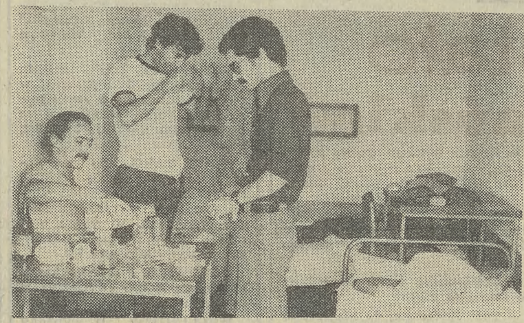
Algierscy studenci czują się jak w domu.

Czas, aby zainteresowane strony narzecz się dogadały. Byłoby to z korzyścią przede wszystkim dla turystów, których w tym sezonie MHS przyjął już około 10 tysięcy. (im)