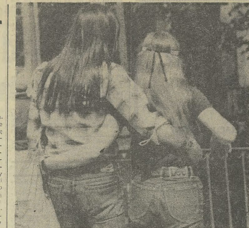
Kto jest kto?

W ten sposób władza zatacza coraz szersze kręgi, każdy ma możliwość dostać niewielką