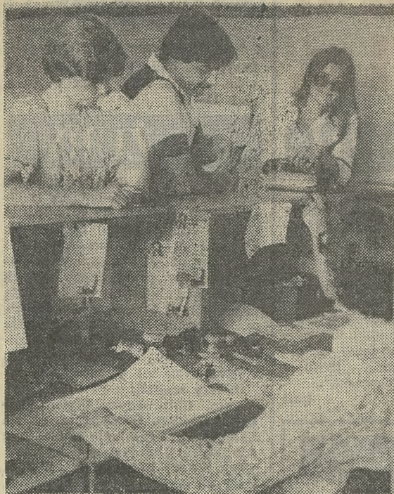
Mimo wszystko ruch dopisuje.