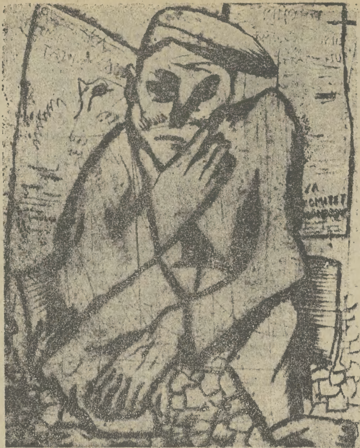
„Bezrobotny” — rys. Jonasz Stern