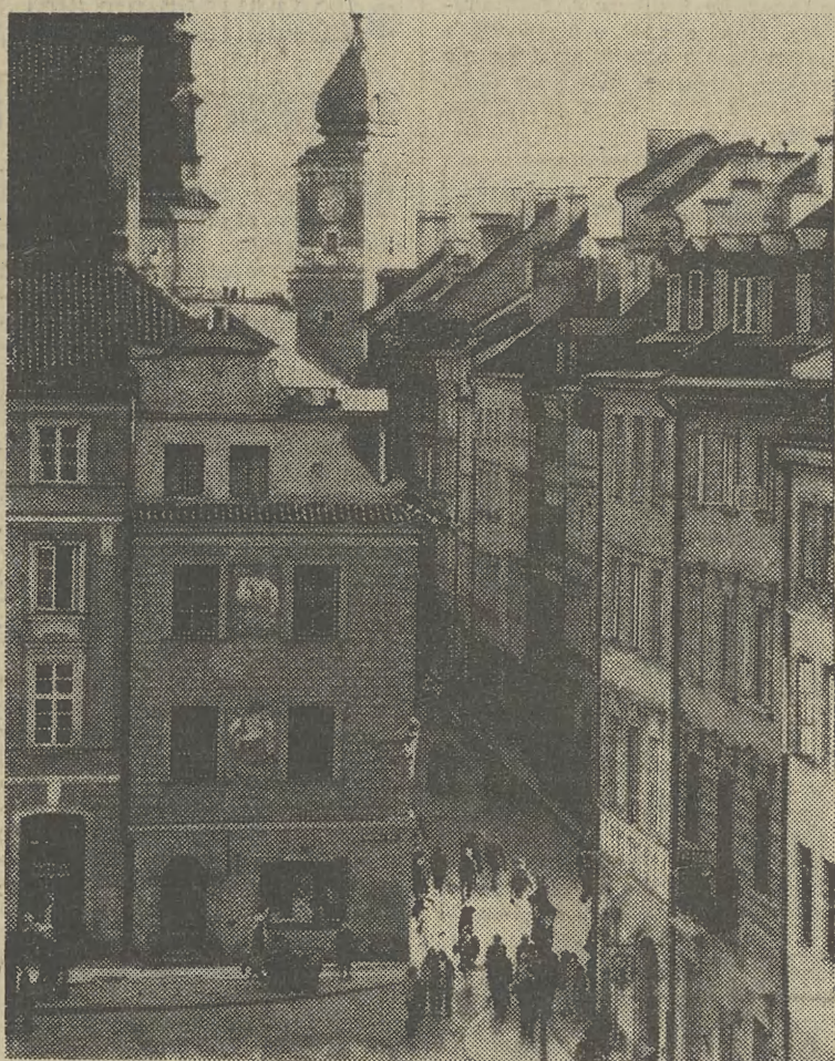
Lada moment warszawskie Stare Miasto (zupełnie przeciw nowe) zacznie gwałtownie domagać się rewalizacji. Po nauki — zapraszamy do Krakowa.

P.S. Przy budowie Biblioteki Narodowej w Warszawie oczywiście żaden swoisty rekord nie padnie, nawet gdyby budowano ją jeszcze lat dwadzieścia. Pierwszą część Nowego Gmachu Muzeum Narodowego w Krakowie wykopów ziemnych. Trzeci gmach: opracowywanie zbiorów — główne miejsce pracy załogi Biblioteki Narodowej, budynek