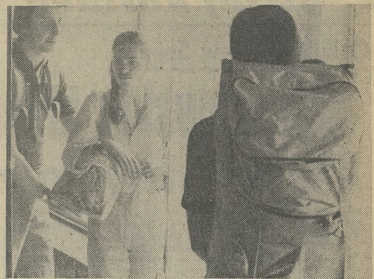
Oto wymarsz na „podbój” Krakowa. On jako dżentelmen obladowany plecakiem... Tak wygląda studenckie lato tego roku.

Wyjątkowo pechowy był dla dzieci mieszkających na osiedlach Bohaterów Września i Piastów ten rok. Najpierw, kiedy społeczeństwo poczuło głód ziemi, zryto wszystkie trawniki zarządzane na nich dzięki działki. Między linią tramwajową a os. Bohaterów Września był duży, zielony teren nazwany szumnie parkiem, albo plantami mistrzejowickimi. Niestety nie zachował się. W tym mie-