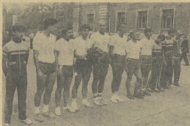
SIEDMIU śmiałków z krakowskiej Akademii Wychowania Fizycznego podjęło się próby pokonania dystansu 1100 km w ciągu 12 dni z Krakowa przez Dobiegniew (Waldenberg) do Gorzowa Wielkopolskiego. Na naszym zdjęciu: w białych koszulkach tuż przed złożeniem kwiatów na Grobie Nieznanego Żołnierza. Chwilę później wyruszyli na trasę, o czym pisaliśmy we wczorajszym „Echu”.