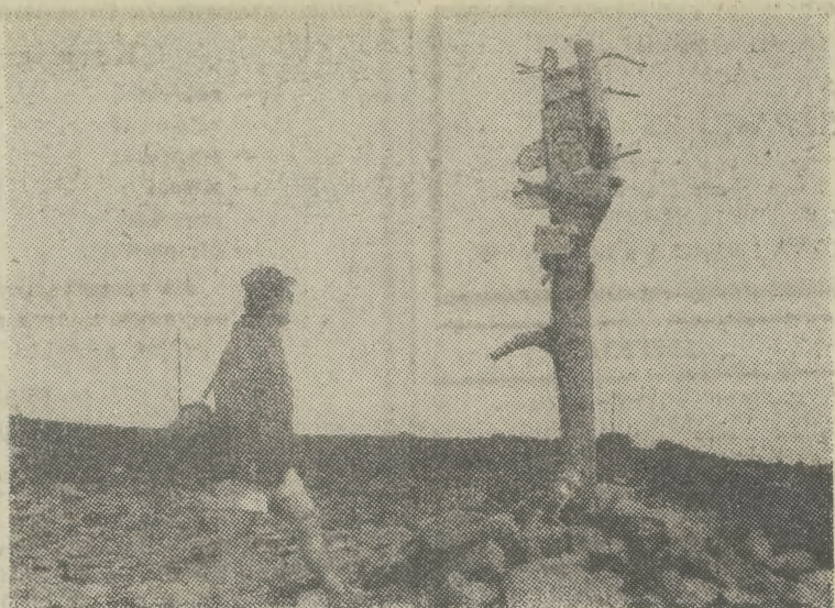
NA szczycie Babiej Góry najczęściej spotkać można... panów!