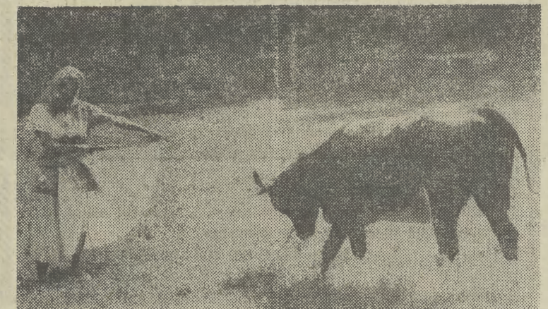
CORRIDA w stylu polskim...

W LENINGRADZIE wydano „Czerwoną księgę” RFSRR, w której zaprezentowano 5383 gatunki ginących roślin. Księgę przygotował do druku Instytut Botaniczny Akademii Nauk ZSRR. Zbiór ten stanowi oficjalny dokument, który należy wykorzystać przy planowaniu wielkich przedsięwzięć ekologicznych, budowy nowych obiektów przemysłowych, przy pracach melioracyjnych i rolnych. Wszystkie rośliny znajdujące się w „Czerwonej Księdze” są chronione prawem. Obecnie przygotowuje się taką samą publikację poświęconą światu zwierzęcemu. (X)