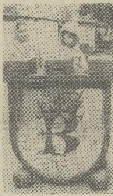
JUŻ DO POŁOWY zapełniła się skarbonka na Rynku, a ofiarodawców nadal nie brakuje.