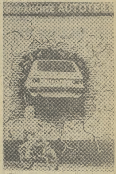
TAKĄ reklamę zafundował sobie właściciel garażu w Kasel w RFN.

ka, dotychczasowego sekretarza KW PZPR w Tarnobrzegu; powołanie na funkcję przewodniczącego Komisji Propagandy KC PZPR Mieczysława F. Rakowskiego.