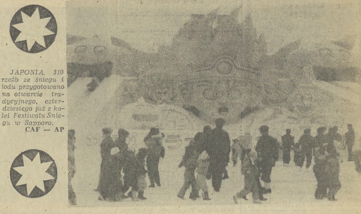
JAPONIA. 310 rzeźb ze śniegu i lodu przygotowanych na otwarcie tradycyjnego, czterdziestego już z kolei Festiwalu Śniegu w Sapporo.