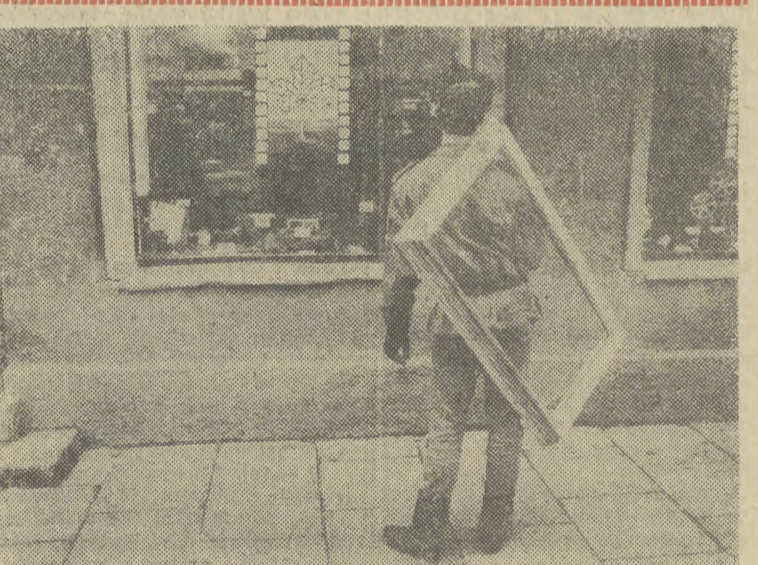
GDY szklarz nie chce przyjść do okna...