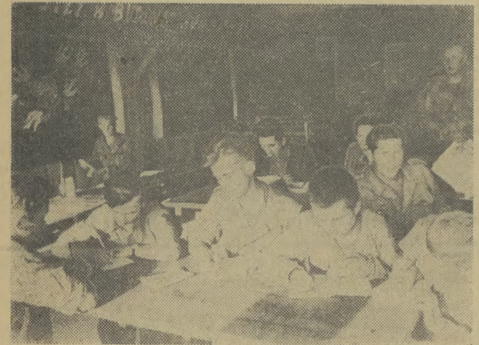
Wieczorem, w świetlicy brnacy piszą listy do rodziców o swej pracy, nauce i rozrywkach kulturalnych w brygadzie