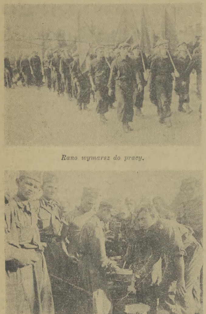
Rano wymarsz do pracy.