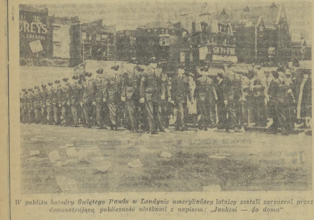
W pobliżu katedry Świętego Pawła w Londynie amerykańscy lotnicy zostali zarzuceni przez demonstrującą publiczność ulótkami z napisem: „Jankesi — do domu”

Ostatnio prasa nasza coraz częściej donosi o uzyskaniu dużych oszczędności dzięki spalaniu mułu węglowego.