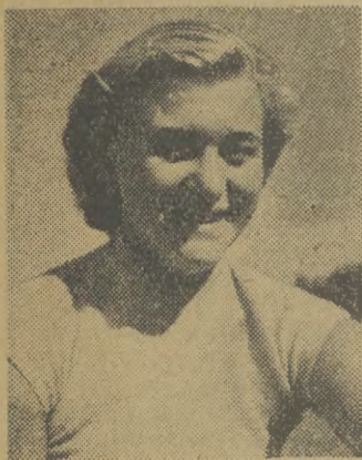
Dobranowska pływaczka Dobranowska wykazała w Berlinie bardzo dobrą formę, uzyskując szereg sukcesów. Ostatnio w towarzyskich zawodach pływackich Dobranowska ustanowiła nowy rekord Polski na 200 m. st. motylkowym — 3,14,3 min.