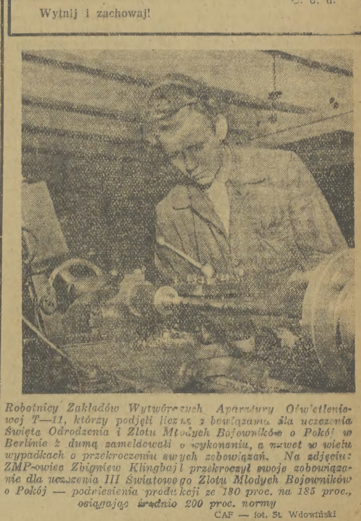
Robotnicy Zakładów Wytwarzania Aparatury Oświetleniowej T-11, którzy podjęli pracę z intensywnością dla uczczenia Święta Odrodzenia i Złoty Młodych Bojowników o Polskę w Berlinie...

Widzimy więc, że kolejarze robią wszystko, by sprostać czekającym trudnościom na odcińku przewozów jesiennych.