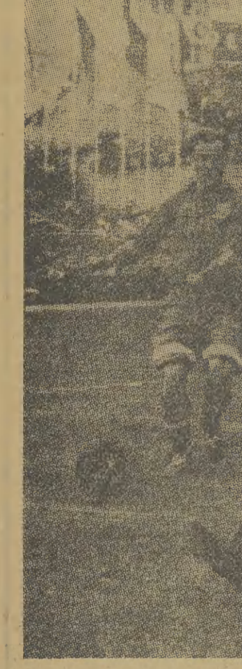
W Berlinie gościła światowej sławy radziecka drużyna piłkarska Dynamo Moskwa, która pokonała dwukrotnie reprezentację NRD 5:1 i 2:0. Na zdjęciu doskonały bramkarz radziecki Chomicz przygotowuje się do obrony strzału skrzydłowego NRD — Schroetera, któremu uтрудnia

Po raz pierwszy w Polsce zostanie zorganizowana największa sportowa impreza, jaką będzie tegoroczna Letnia Spartakiada Zrzeszeń Sportowych.