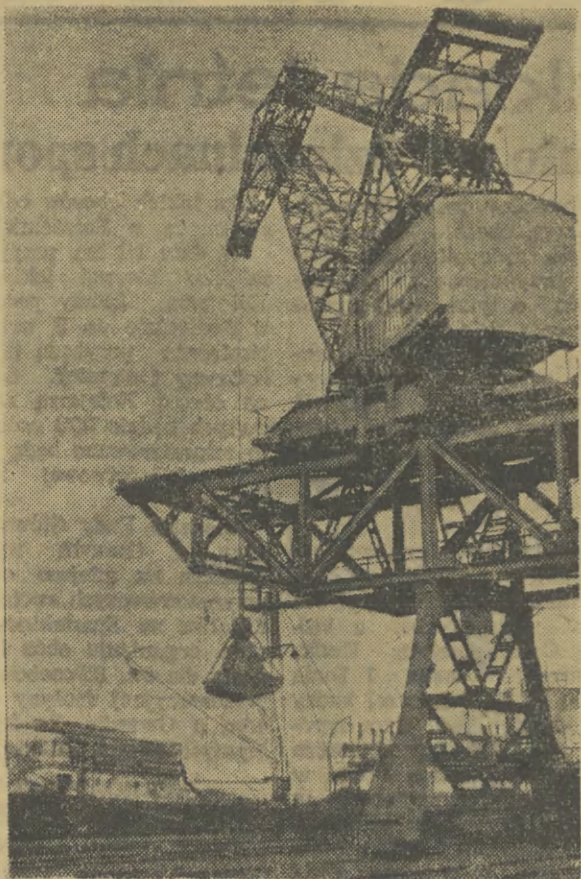
Zadawanie węgla na rurociągu w szwedzkiej CAF

"CZARNE DIAMENTY" — WĘGIEL POLSKI, POPRZEZ NASZE PORTY WEDRUJE W ŚWIAT