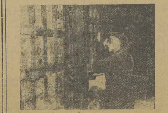
20 lipca br. w ramach uroczystości związanych z 25. rocznicą śmierci F. Dzierżyńskiego, została nazwana jego imieniem huta „Bankowa” w Dąbrowie Górniczej...