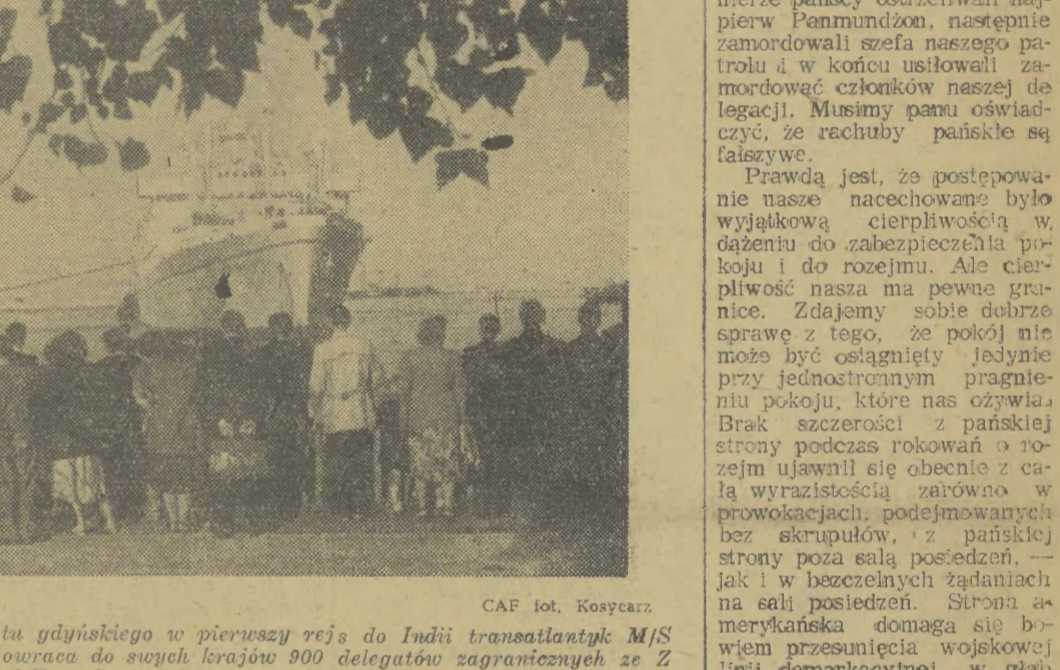
Dnia 16 bm. wyruszył z portu gdyńskiego w pierwszy rejs do Indii transatlantyk M/S Batory. Na pokładzie statku powraca do swych krajów 900 delegatów zagranicznych ze Złotu Młodych Bojowników o Pokój w Berlinie. Licznie zgromadzeni w porcie mieszkańcy Gdyni serdecznie żegnali odjeżdżających.