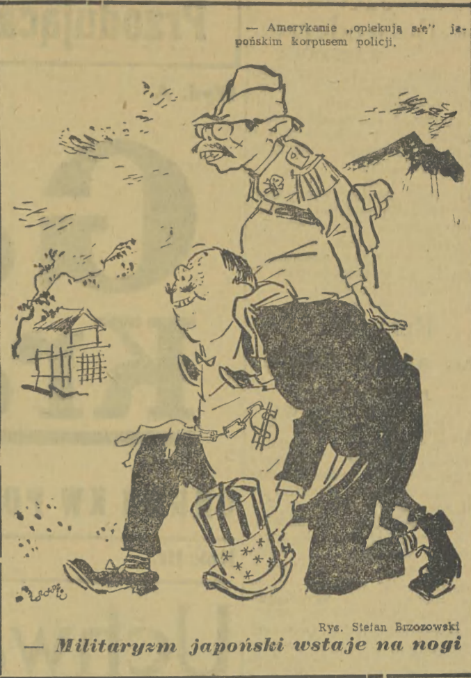
— Amerykanie „opiekują się” je-pońskim korpusie policji.

Wprowadzony niedawno przez titowców tak zwany „nowy system finansowy” daje kapitalistom nowe jeszcze możliwości wyzysku gospodarki krajowej. Na podstawie tego systemu, jak informuje prasa titowska, państwo nie gwarantuje obecnie przedsiębiorstwom i spółdzielniom niezbędnych środków finansowych na ich rozwój, krety ogranicza się do kontroli ich budżetu. Kredyty otrzymują tylko takie przedsiębiorstwa, które uznane są ze strony kapitału bankowego za rentowne, lub niezbędne dla gospodarki kraju. Jasne jest, że banki, w których panoszą się kapitał amerykański zasila funduszy przedsiębiorstwa pracujące na rzecz wojny, względnie eksportujące do Stanów Zjednoczonych. Skutek tej polityki finansowej jest jasny. Przedsiębiorstwa produkujące dla potrzeby ludności, masowo bankrutują. W