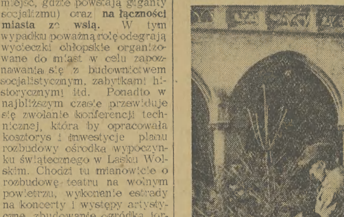
Las świerkowy pod Sukiennicami

wybieczek do miejscowości wy- różniających się pod względem wykonywania planów gospo- darczych, ewentualnie do mi- ojsce, gdzie powstają giganty socjalizmu) oraz na łączności miasta ze wsią. W tym wypadku poważną rolę odegra- ją wycieczki oświatowe organizo- wane do miast w celu zapoz- nawania się z budownictwem socjalistycznym, zabytkami hi- storycznymi itd. Ponadto w najbliższym czasie przewiduje się zwolnienie konferencji tech- nicznej, która by opracowała kosztorys i inwestycyjny planu rozbudowy ośrodka wypoczyn- ku świątecznego w Łasku Wols- kim. Chodzi tu mianowicie o rozbudowę teatru na wolnym powietrzu, wykonanie estrady na koncerty i występy artysty- czne, zbudowanie ogródka for-