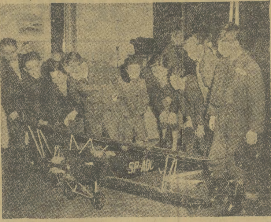
W salach Młodzieżowego Domu Kultury w Warszawie została otwarta Ogólnopolska Wystawa Modelarska zorganizowana przez Ligę Morską i Ligę Lotniczą. Na wystawie znajdują się modele historycznych i współczesnych jednostek morskich oraz lotniczych. Na zdjęciu: młodzi entuzjaści lotnictwa oglądają z zainteresowaniem model dwupłatowca.