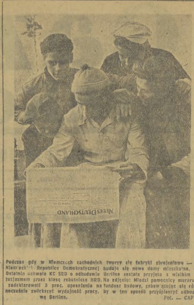
Podczas góy w Niemczech zachodnich tworzą się fabryki zbrojeniowe — w Niemczech! Republice Demokratycznej budują nowe domy mieszkalne. — Ostatnio uchwała KC SED o odbudowie Berlina została przyjęta z wielkim entuzjazmem przez klasę robotniczą HRD. Na zdjęciu: Młodzi pomocnicy murarzy zacierali w 3 proc. ulepszenia na funduszu budowy, zobowiązuje się równocześnie zwiększyć wydajność pracy, by w ten sposób przyspieszyć odbudowę Berlina.

W rezolucji, nazwanej obłudnie rezolucją „o działalności na rzecz pokoju” rada naczel-