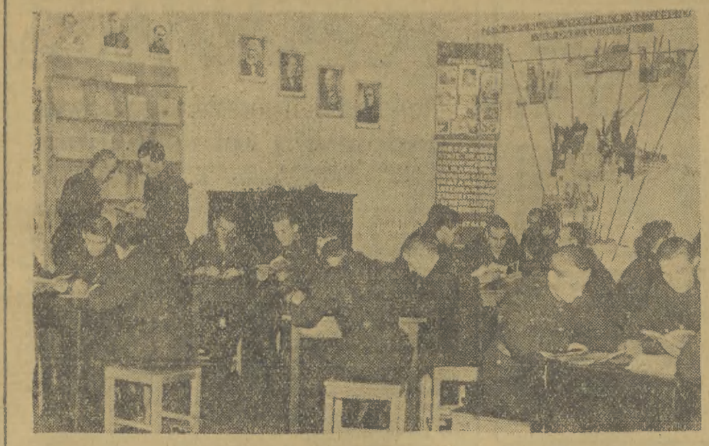
Podstawą wychowania żołnierzy i młodzieży wojskowej jest oświata polityczna. Opracowanie w kształtowaniu światopoglądu młodzieży wojskowej odgrywa światlica, w której żołnierze spędzają czas wolny od pracy. Na zdjęciu: młodzi żołnierze czytają książki i czasopisma w świetlicy swojej jednostki.