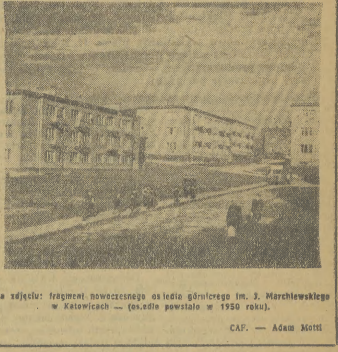
Na zdjęciu: fragment nowoczesnego osiedla robotniczego im. J. Marchlewskiego w Katowicach — (osiedle powstało w 1950 roku).