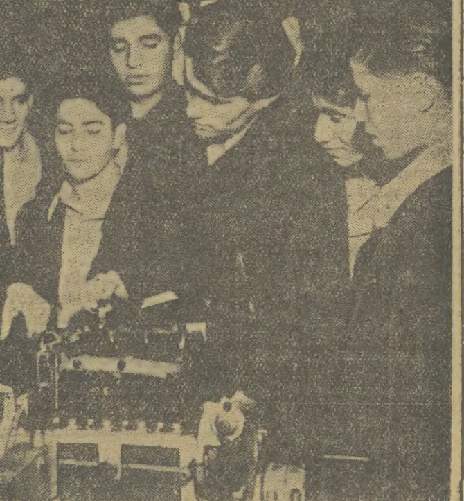
Młodzież grecka, która znalazła w NRD schronienie przed terrorem faszystowskim, jest otoczona opieką rządu. Wszystkie dziewczęta i chłopcy greccy uczęszczają do szkół z młodzieżą niemiecką.