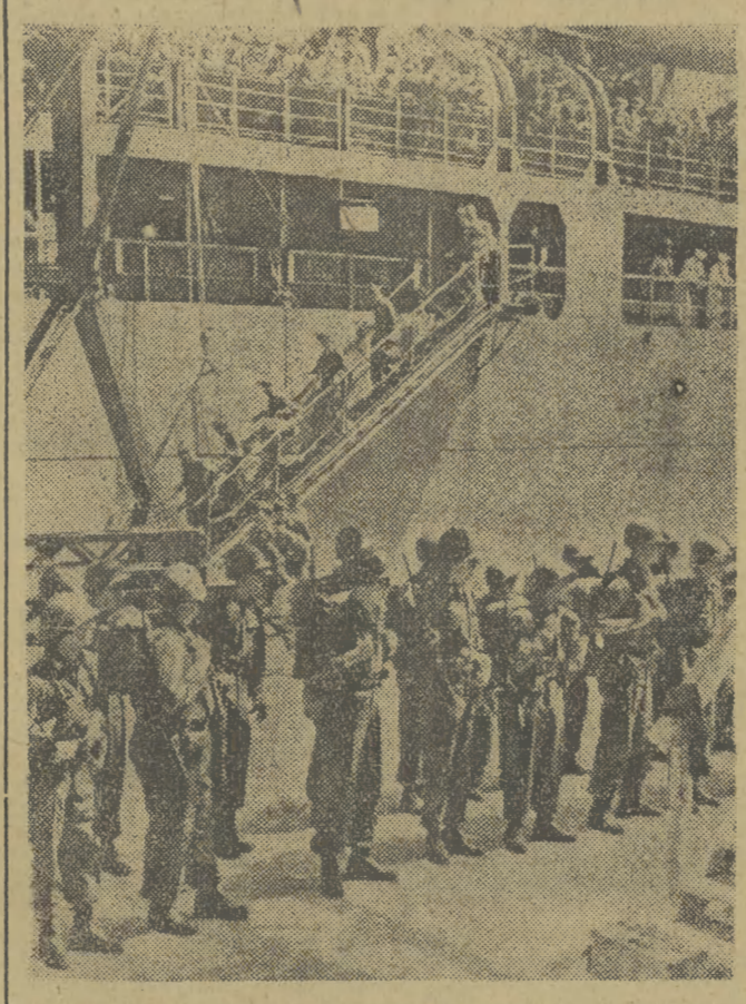
Do portów Niemiec zachodnich przybywają codziennie nowe transporty wojsk amerykańskich.