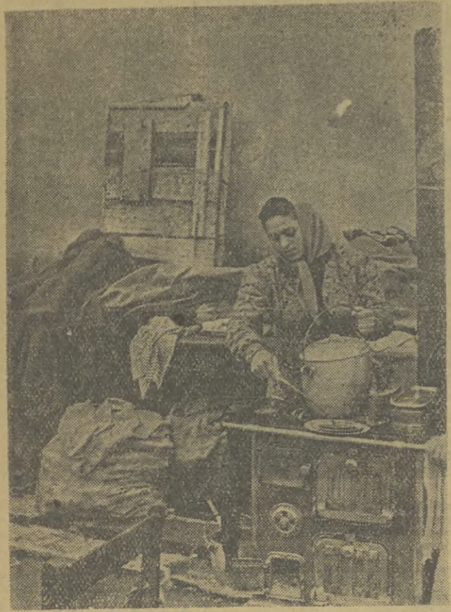
Powódz we Włoszech okazała się bardziej katastrofą niż powódź w Polsce. Woda która zalała ogromne tereny, nie cofnęła się wcześniej niż w 1952 roku...