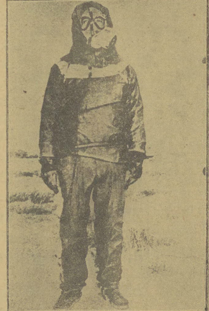
Amerkańskie wojska od dawna przygotowywały się do wojny bakteriologicznej. Świadczy o tym przygotowanie specjalnej oddziały ochronnej, mającej zabezpieczyć oddziały ludności amerykańskiej przed epidemiami, jakie wybuchną na skutek zruchożenia przez nich bakterii.