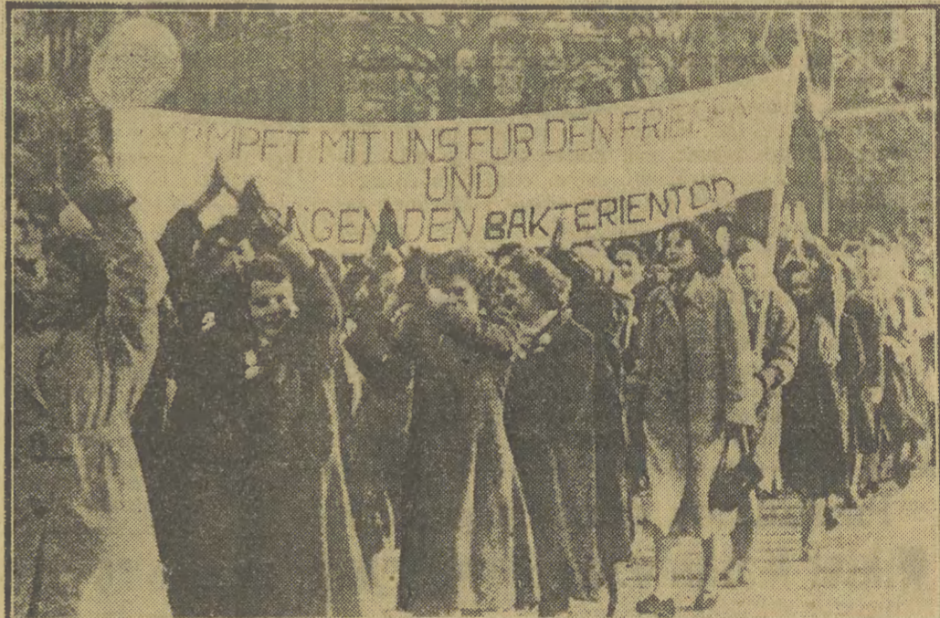
Protestujący w Iranie przeciwko ingerencji Anglii.

Autorzy deklaracji podkreślają, że pomimo istnienia międzynarodowego zakazu używania broni bakteriologicznej, broń ta była stosowana podczas drugiej wojny światowej przez japońskich zbrodniarzy wojennych. Ocaleni zaś amerykańskie siły zbrojne zostały oskarżone o prowadzenie wojny bakteriologicznej w Korei i w Chinach północno-wschodnich.