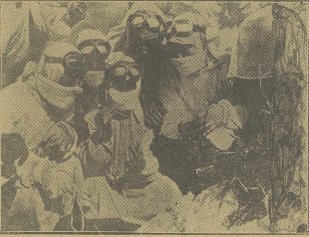
Na zdjęciu: chińska ekipa lekarska przeprowadza badania na miejscu zrzutów zarzaskanych owadów.

Przy poparcu ze strony całej ludności, odpowiednie środki zaradcze. W konkluzji tego rozdziału Komisja stwierdza, iż doszło do wniosków, że owady zakazane bakteriami chorób epidemicznych były zrucane na obszar Korei północnej przez samoloty amerykańskie.