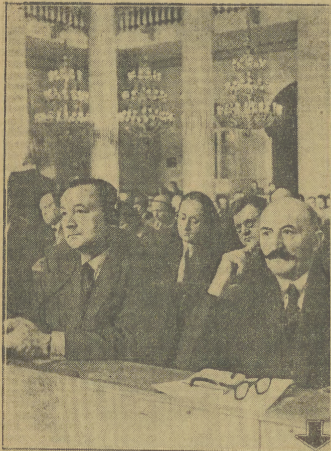
Na zdjęciu: posiedzenie plenarne w Sali Kolumnowej. Na pierwszym planie delegacji polskiej.