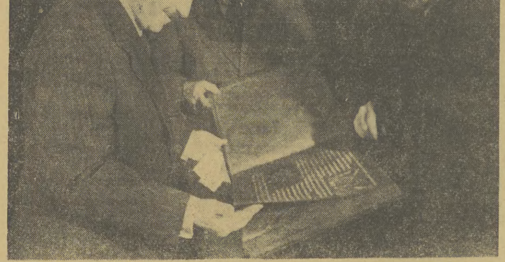
Prezydent Bierut żywo interesuje się sprawami ludzi pracy. Szczególną opieką otacza górników. Na zdjęciu: Towarzysz Bierut przyjmuje u siebie delegację górników.