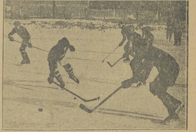
W Rumunii sezon zimowy w pełni. Hokeiści rozgrywają...