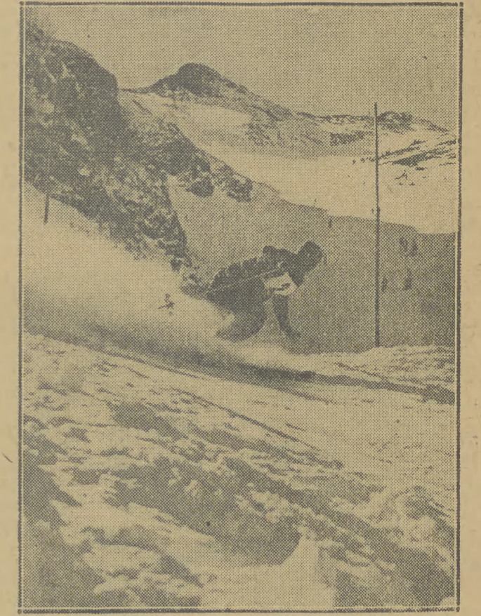
Narciarze nasi starannie przygotowują się do Akademickich Mistrzostw Świata...