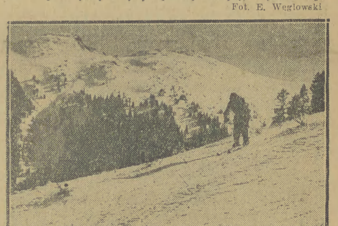
Narciarze po wyjeździe na szczyt Kasprowego Wierchu...