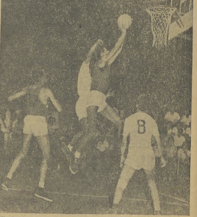
W okresie zimowym największym producentem ciesz się rozgrywki...