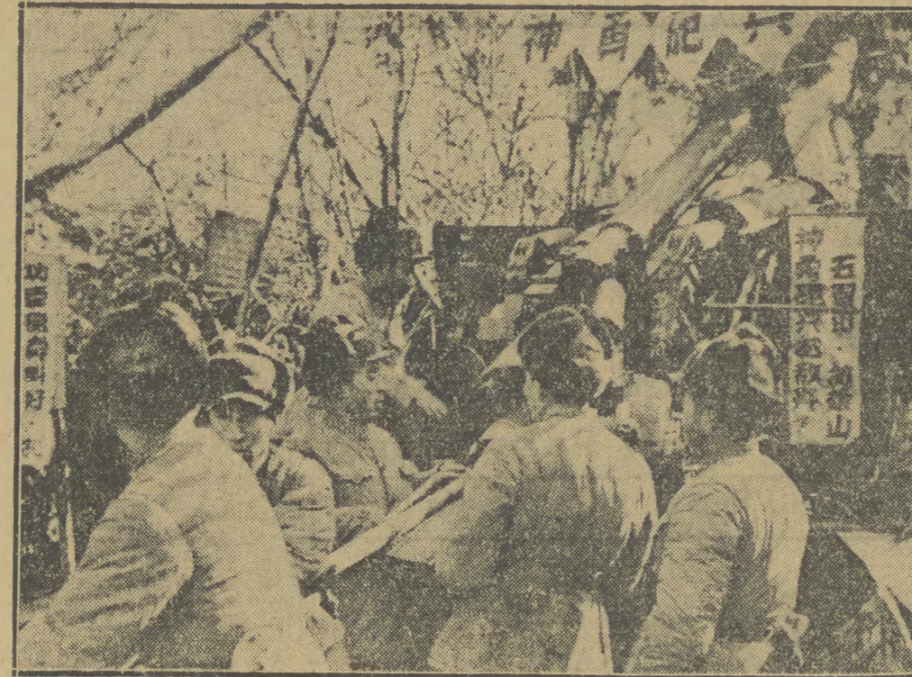
Z walk narodu koreańskiego przeciw amerykańskiemu agresorowi o wolność i niezawisłość Kreei. Na zdjęciu: jednostka artylerii Chińskich Ochotników, która zadała imperialistycznym interwentom w rejonie Sang-kumyung poważne straty.