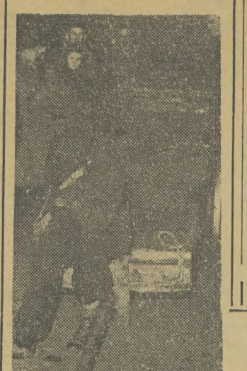
Na szczęście skończyło się tylko na „postawieniu” samochodu w poprzek jezdni. Przytomny kierowca...

Miał przeznaczony dla zakładów ceramicznych winien być wydobyty z piwnic i złożony na ulicach lub w podwórkach.