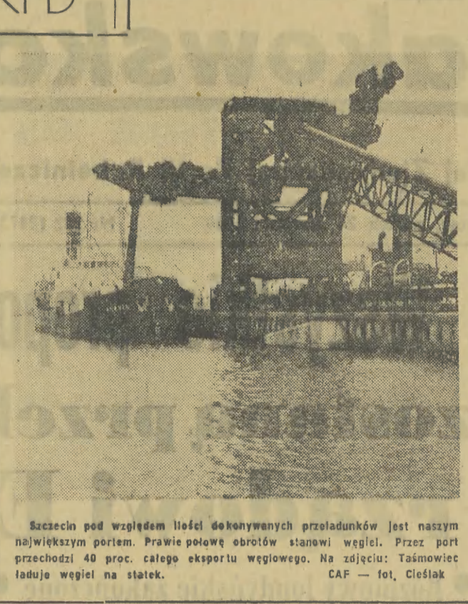
Szczecinie pod względem ilości dokonanych przeladunków jest naszym największym portem. Prawie połowę obrotów stanowi węgla. Przez port przechodzi 40 proc. całego eksportu węgla.