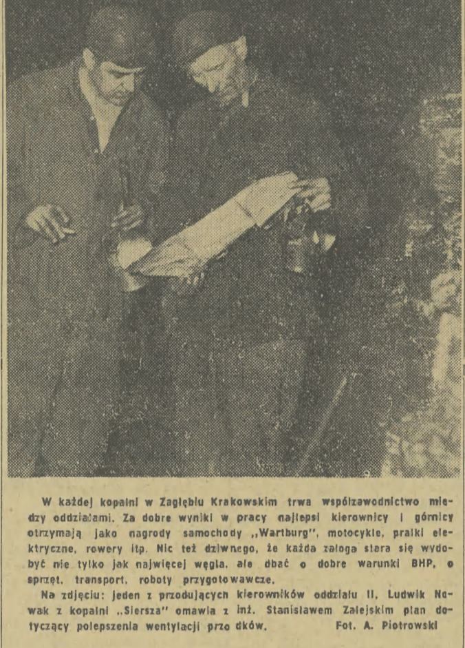
W każdej kopalni w Zagłębiu Krakowskim trwa współzawodnictwo między oddziałami. Za dobre wyniki w pracy najlepiej kierownicy i górnicy otrzymują jako nagrody samochody „Wartburg”, motocykle, pralki elektryczne, rowery itp. Nic też dziwnego, że każda załoga stara się wydobyc nie tylko jak najwięcej węgla, ale i obić o dobre wursta BHP, o sprzet, transport, roboty przygotowawcze.

W północnej Nadrenii — po delegacji KPD nadal korzystają z immunitetu poselskiego, policja aresztowała deputowanego komunistycznego Zscherpe.