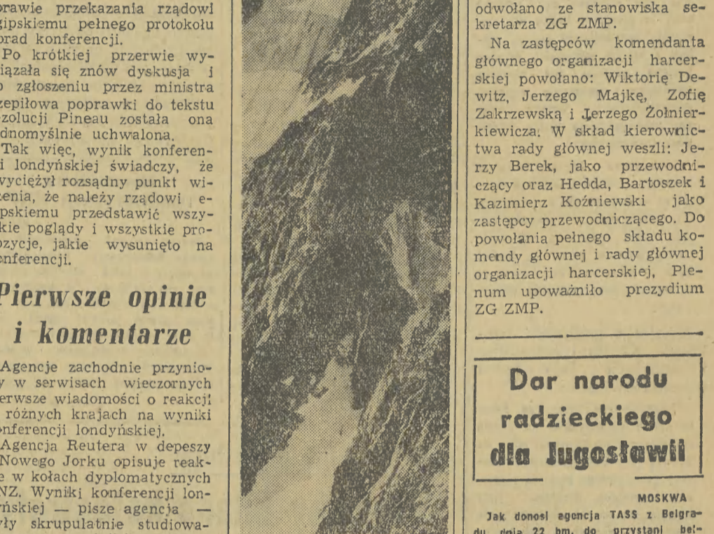
„W masywie Mont Blanc”

LONDYN W czwartek o godzinie 17 czasu środkowo-europejskiego zakończyła swe 8-dniowe obrady. Na wniosek francuskiego ministra spraw zagranicznych Pineau, delegacji 22 krajów uczestniczących w konferencji uchwalili jedomyślnie następującą rezolucję: