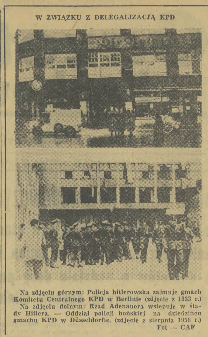
Na zdjęciu górnym: Policja hitlerowska zajmuje gmach Komitetu Centralnego KPD w Berlinie (zdjęcie z 1933 r.) Na zdjęciu dolnym: Rząd Adenauera wstępuje w śladu Hitlera. — Oddział policji bońskiej na dziedzińcu gmachu KPD w Düsseldorfie. (zdjęcie z sierpnia 1956 r.)

MOSKWA Pierwszy występ przebywających w ZSRR piłkarzy przodownika II ligi piłkarskiej CWKS Kraków przyniósł im w Charkowie remis 1:1 z miejscową drużyną Awangard.