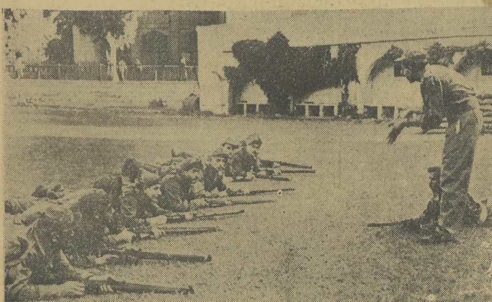
Zgodnie z dekretem prezydenta Nassera w skład Narodowej Armii Wyzwoleńczej, która ma istnieć niezależnie od armii regularnej, wchodzić będą członkowie gwardii narodowej oraz ochotnicy w wieku od lat 18 do 50. Na zdjęciu: Szkolenie ochotników.