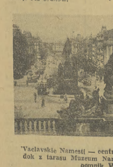
Vaclavské Namesti — centrum Pragi. Na zdjęciu: Włok z tarasu Muzeum Narodowego (w perspektywie gmach Wacława)

Dziesięciosobową windą udajemy się na siódme piętro. Jest tu królestwo mebli. Salony, gabinety, pokoje stonowane, sypialnie — „do wyboru i do koloru”. Nie trzeba się niepokoić i wyliczać „czujności” w stosunku do wykonania. Można być pewnym, że zakupiona sofa będzie się zamulała i po kilku miesiącach, a drzwi nie „przeschną”. Można też z góry gwarantować, że fornir od biurka nie odsklepi się, nawet gdyby w pokoju było bardzo ciepło. Oprócz wyższej, niż u nas kultury i odpowiedzialności społecznej robotnika, mamy w Czechosłowacji lepiej „ustawione” normy i bodźce ekonomiczne w dziedzinie dbałości o jakość wykonania. Oto niewątpliwie tajemnica tych sukcesów produkcji bez braków.