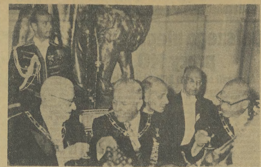
Na zdjęciu: W czasie obiadu wydanego w rezydencji prezydenta Finlandii na cześć przewodniczącego Prezydium Rady Najwyższej ZSRR — K. J. Woroszyłowa. Od lewej b. prezydent Paasikivi, N. J. Woroszyłow i prezydent Kekkonen.