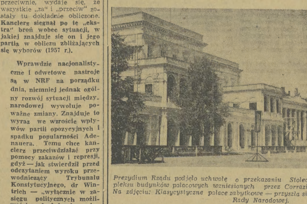
Prezydium Rady podjęło uchwałę o przekazaniu Stołecznej Radzie Narodowej kompleksu budynków pałacowych wzniesionych przez Coraziego. Na zdjęciu: Klasycyzyczne pałace zabytkowe — przyszła siedziba Prezydium Stołecznej Rady Narodowej.