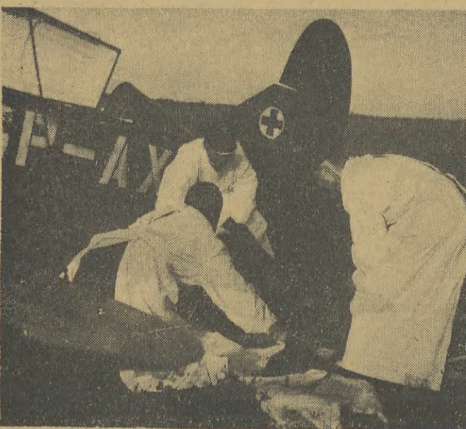
Jednym z punktów programu był pokaz przewiezienia rannego samolotem sanitarnym.

Na pokazy lotnicze przybyło kilkadziesiąt tysięcy osób. Nie więc dziwnego, że na wszystkich liniach tramwajowych w kierunku Ronda pałanów w godzinach poprzedzających imprezę straszny tłok. Najbardziej przepelnione były wozy numer „A”, kursujące w dużych odstępach czasu. Toteż wiele osób wyrażało słuszne pretensje pod adresem MPK z powodu nieuruchomienia w tym dniu dodatkowych wozów.