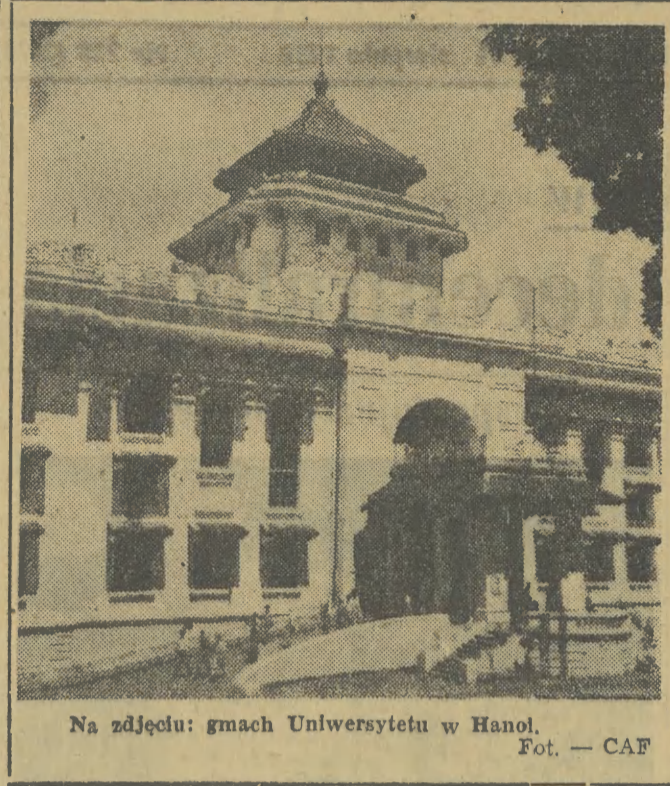
Na zdjęciu: gmach Uniwersytetu w Hanol.