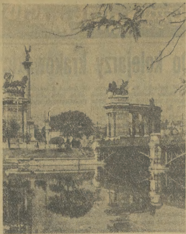
Budapeszt — widok na Plac Bohaterów