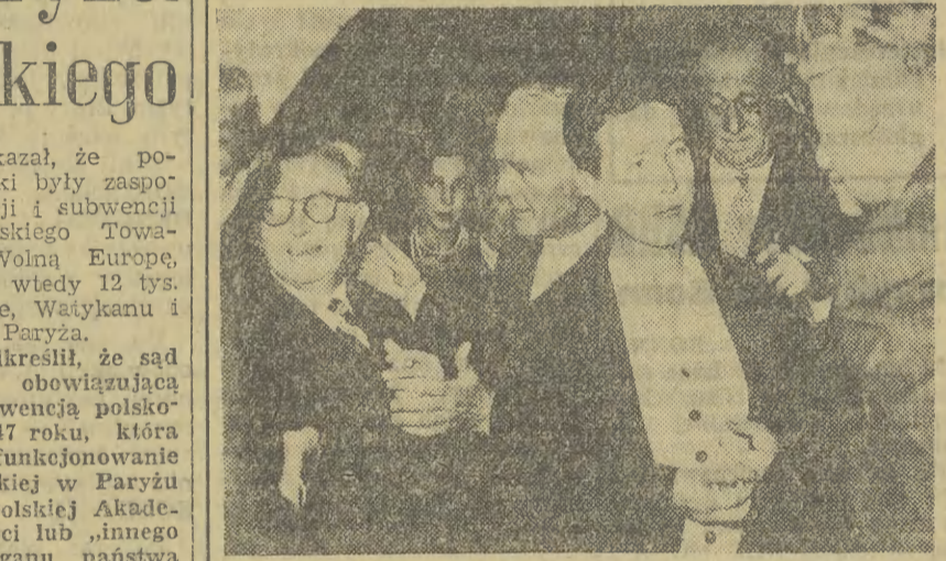
Włoscy artyści wydalili przyjęcie na cześć przebywającego w Rzymie znanego pisarza francuskiego J. P. Sartre'a.