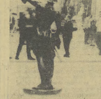
W lipcu zasób doświadczeń wzbogacił się o jeszcze jedno. Dwa recitale zespołu „Anawa” Grechuty na pięknym dziedzińcu Muzeum Archeologicznego zgromadziły 1500 osób. Na ich powołanie złożyli się dwa czynniki: dobry poziom recitalu i występ na otwartej przestrzeni. Zachęcona tym Estrada projektuje także w sierpniu zrealizowanie podobnych imprez. Natomiast inny eksperyment Estrady Krakowskiej zawiódł: Z powodu „pośuchy wakacyjnej” otworzono szeroko bramy dla każdego zgłaszającego się zespołu, bez uprzedniego sprawdzenia jego poziomu artystycznego. Zgłoszyli się (zaledwie) dwa zespoły, z tych „Wiatraczki” zrobiły całkowitą plajtę. Wynikałoby z tego, że czasem lepsza jest całkowita posucha, niż eksperymenty wywołujące ostre protesty widzów.

Trudno ustalić, jaki procent widzów teatralnej stanowił w lipcu i do połowy sierpnia turyści, a jaki „tubyli”. Pomógłby tu badania i Wydział Kultury RN m. Krakowa nosi się z zamiarem zaangażowania odpowiednich specjalistów do zbadania tego problemu drogą ankietowania publiczności teatralnej (np. w czasie antraktywów). Takie badania przyniosłyby odpowiedź na wiele pytań.