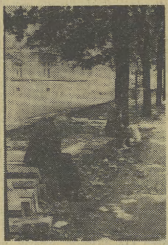
W związku z budową linii tramwajowej uzdużył ulicę Dietla z całej powierzchni i zaparkowania aut. Przygotowanie do wykopania na Placach mieszkańców pobliższych domów przysiadają więc teraz na betonowych prefabrykach.