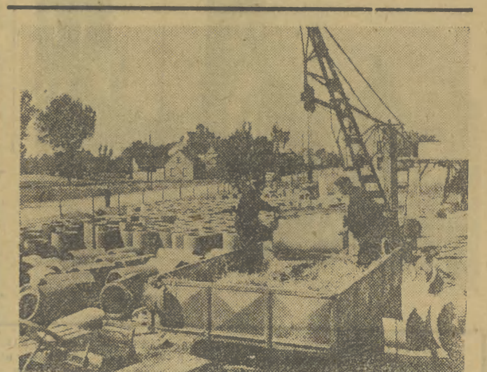
Rawlekie Zakłady Przemysłu Terenowego Materiałów Budowlanych w Miejskiej Górze (pow. Rawicz) produkują m. in. pustaki Alfa, pustaki siropowe DMS oraz materiały kanalizacyjne i kręgi studienne.