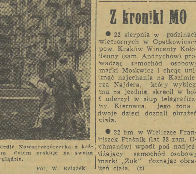
Ostanie Nowogrodzka z każdym dniem zyskuje na swoim wyglądzie.

Pomimo znacznego zaawansowania robót sytuacja ogólna nie jest w sumie zadowalająca. Według oceny Zarządu Inwestycji Szkół Wyższych roczny plan został wykonany w 42 proc. w stosunku do harmonogramu. Krakowskie Przedsiębiorstwo Budownictwa Miejskiego ZBM — generalny wykonawca musi dolażyć więc większych starań, aby inwestycje jubileuszowe zgodnie z uchwałą były oddane w terminie. (K.S.)