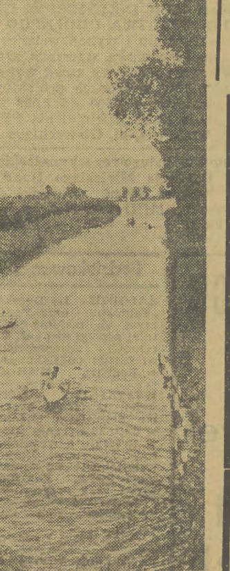
NA MAZURACH Turysty na szlaku wodnym Mikołajki-Ruclane.

Praca czeka Komenda Wojewódzka Milicji Obywatelskiej w Krakowie zawiadamia, że przyjmuje zgłoszenia kandydatów do pracy na stanowiskach milicjantów i kontrolerów ruchu drogowego na terenie m. Krakowa. Ponadto zatrudni 30 kierowników I i II kategorii. O warunkach pracy i płacy informację udzieli Wydział Kadr KW MO, pl. Szepeński 5 oraz wszystkie jednostki MO na terenie miasta.