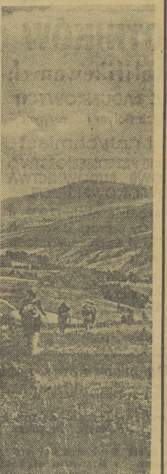
Na szlaku przez Góry Świętokrzyskie. Widok z Klonówki na Radostową i Łysiec.