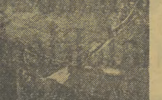
Na zdjęciu: Fragment targu.

W pobliżu miejsca zamachu policja znalazła inną jeszcze ciężarówkę skradzioną właścicielowi. Ustalono, że ciężarówka była zaparkowana na tym samym miejscu przez całe środowie popołudnie. Ekspertci badają odciski palców pozostawione w wozie.