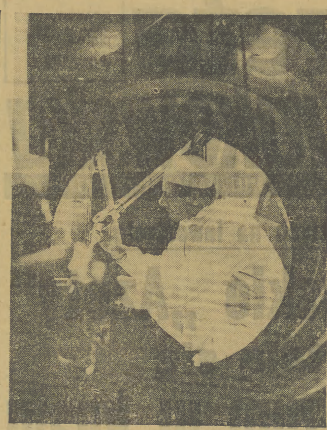
ATOM W SŁUŻBIE POKOJU

cie sprawę stosunków między USA a NRF oraz zapewnił Adenauera, że w polityce wojennej USA w Europie nie zaszły żadne zmiany. Mówiąc o problemie kongijskim Kennedy oświadczył, iż administracja amerykańska popiera opublikowany niedawno plan U Thanta w sprawie rozwiązania kryzysu kongijskiego. W odpowiedzi na pytanie jednego z dziennikarzy czy uważałby za rzecz pożyteczną spotkanie się z N. S. Chruszczowem, jeśli szef rządu radzieckiego przybędzie do Nowego Jorku na sesję Zgromadzenia Ogólnego NZ — prezydent Kennedy stwierdził, że nie ma dotychczas żadnej wiadomości na temat ewentualnego przybycia N. S. Chruszczowa do USA. Oczywiście — dodał prezydent Kennedy — jeśli szef rządu radzieckiego przybędzie, to mam nadzieję, że będzie miał możliwość spotkania się z nim i odbycia rozmowy. Następnie prezydenta Kennedy'ego zapytano, czy wiadomo mu coś na temat „ładowania na Kubie wojsk komunistycznych” — jak doniosły o tym niedawno niektóre dzienniki amerykańskie. Prezydent odpowiedział, że rząd Stanów Zjednoczonych nie ma żadnych informacji na ten temat i dodał, iż rząd amerykański wie, że ostatnio wzrosły dostawy różnych towarów i sprzętu z krajów socjalistycznych na Kubę; zwiększyła się także liczba różnych specjalistów przybywających na Kubę z tych krajów. Gdy prezydenta Kennedy'ego zapytano, czy uważa, że jest to wymierzone przeciwko kłótni z krajów Ameryki Środkowej — prezydent odpowiedział, że rząd amerykański nie ma żadnych dowodów, iż twierdzenia tego rodzaju są uzasadnione.