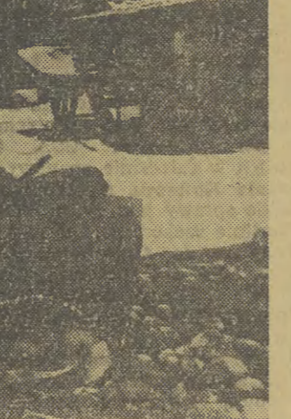
Na zdjęciu: Fragment targu.