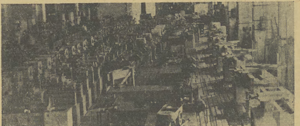
Wzrost produkcji w AFAM-ie. Wydział Montażu Andrychowskiej Fabryki Maszyn — widać taśmę potokowej obrabiarek „TUE-40”. Co dwie i pół godziny z taśmy schodzi nowa, gotowa obrabiarka. W tle sploty taśm, kompilacja maszyna.

KAZIMIERZ NAD WISŁĄ Fragment Rynku