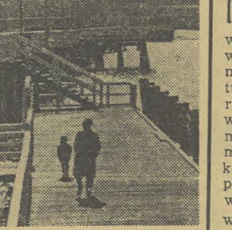
Wielką atrakcją dla wczasowiczów jest piękne soppockie moło.

Kłedy na pokazie była rogataca z Vive Fezencac (Francja) trzy „najlepiej niejezde krowy” udekorowano kokardami „Miss” — te zdenerwowane wyrwały się z ogrodzenia i pobiegły do miasta. Wzburzyły popłoch na ulicach, a następnie wpadły do sklepu jarzynowego, w którym poprzeczwały półki i kosze. Pogon została uciekinierki zajęte konsumpcją salaty. Organizatorzy musieli zapłacić wysokie odszkodowanie. (zg)