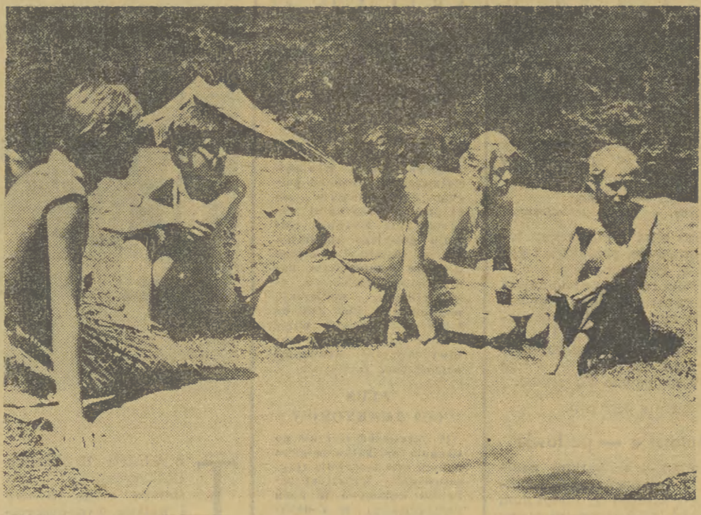
Wydział HGRN „Biedronek” z Tomaszowa Marzowieckiego w Trybszu podczas krótkiej narady roboczej.

raglew, trzeba przyznać, że dała egzamin. Młodzież, zasilająca w radach narodowych, obok starszych, czuła się współgospodarzem wsi, odpowiedzialna za wszystko, co się tam dzieje. A dzięki swemu zapałowi, inicjatywie i pomysłowości, tak „rozbroiła” stałych mieszkańców Spisza, że ci nawet nie wiedząc kiedy, wspólnie z harcerzami zaczęli realizować to, o czym przedtem niejednokrotnie nie chcieli słyszeć. Działają sami dominującą siłą o biblioteki, a pomoc w organizowaniu życia kulturalnego. Przedtem służba zdrowia miała tu niemało kłopotów z wykrywaniem i leczeniem chorób. Dzisiaj za wsi spiskich u lekarzy zjawia się coraz więcej pacjentów. Ba, proszą o stałą opiekę lekarską, chcą mieć u siebie punkty sanitar-