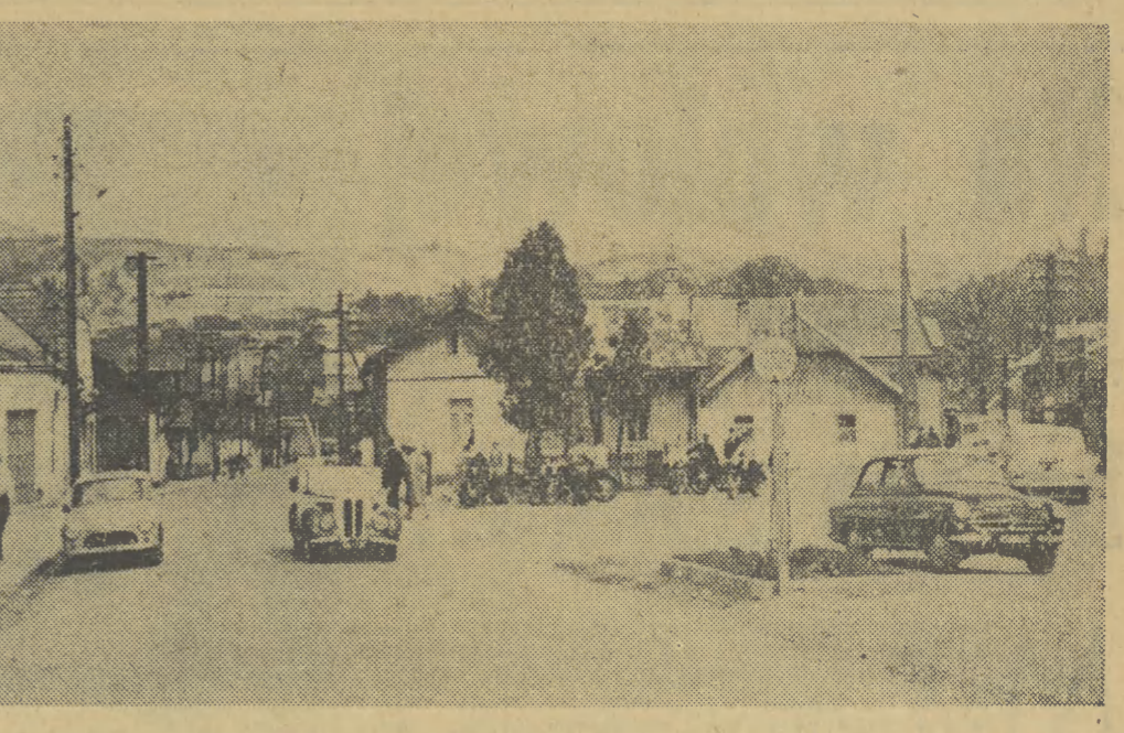
Króleńsko nad Dunajem.