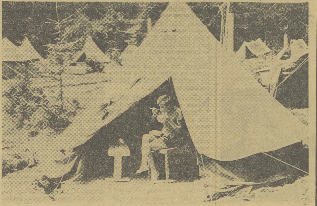
W upalny dzień obiad lepiej smakuje w cieniu namiotu.