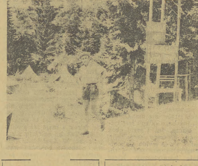
Weszliście do Komendy Akcji „Spisz”. W głębi fragment obozu.