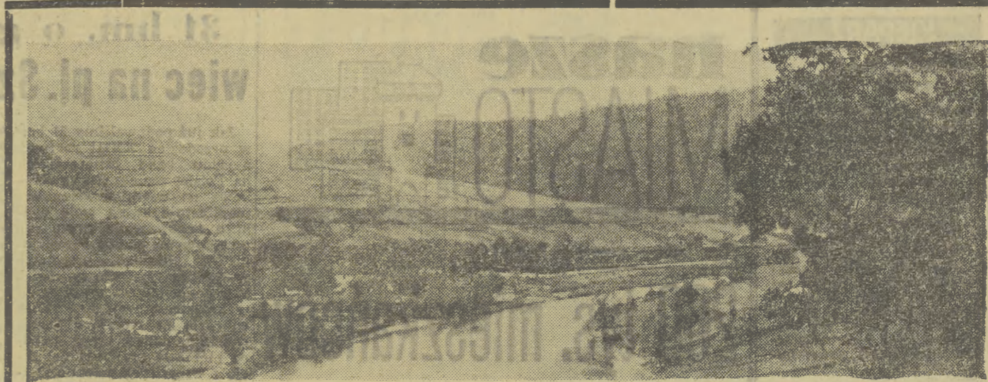
Muszyna — widok na Poprad