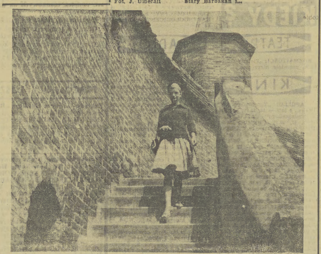
Stary Barbakan L.

Usłyszal iopot skrzydeł. Stado spłoszonych pelikanów zatoczyło kilka kręgów na drzewami ylang-ylang, i odleciało w kierunku zatoki. Kogut zapiał wysokim crescendo, odpowiedział mu inny, i jeszcze inny — na Haiti koguty pleją przez całą noc.