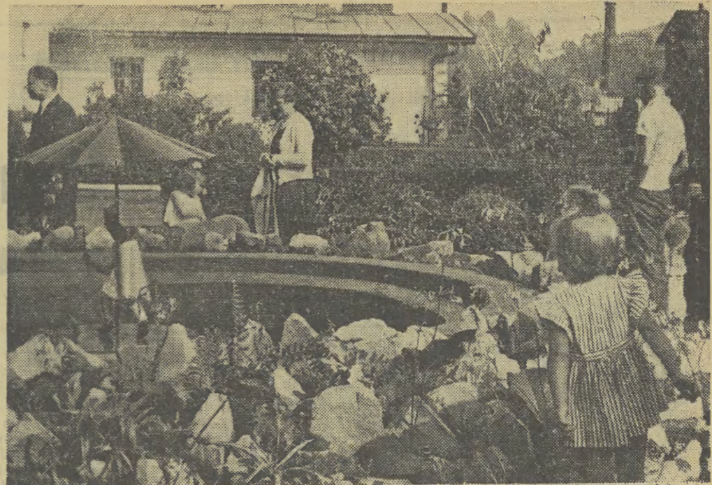
Przed świętem kolejarzy

W najbliższej grze wygrana z 5 trafieniami wynosić będzie około 250,000 złotych!