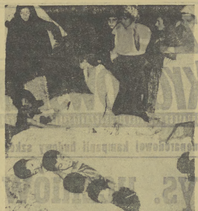
Ludność okręgu Neapolu, nawiedzonego ostatnio trzęsieniem ziemi, znajduje się w tragicznej sytuacji. Tysiące ludzi blawkuje pod gołym niebem. Na zdjęciu: kobiety z dziećmi z wioski Montecalvo, gdzie znajdował się ośrodek trzęsienia ziemi.

BONN (PAP). W poniedziałek wieczorem podczas manewrów górskich szwajcarskiej siły zbrojnych uległy katastrofie w rejonie przełęczy Furka 3 myśliwce odrzutowe typu „Venom”. Wszyscy trzej piloci ponieśli śmierć. Jak podały szwajcarskie władze wojskowe odrzutowce tworzyły „3” patrolowo i przypuszczalnie z powodu silnego zamglenia zahaczyły o występ skalny.