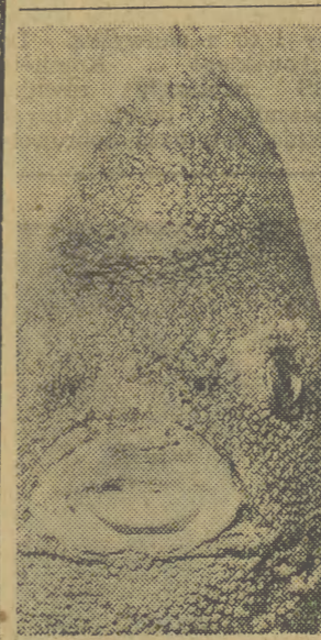
Najpiękniej wśród ryb uśmiecha się ponad wszystkie tasma, czyli sałkę morską...

KONIE NA EKSPORT Polska jest jednym z najbardziej znanych eksporterów koni na świecie. Nasze araby kupuje nawet Egipt, Szwajcaria corocznie importuje z Polski ok. 400 szt. „remontów”. Prócz tego krajowe ośrodki hodowlane eksportują kilkadziesiąt koni zasodowych i sportowych rocznie.