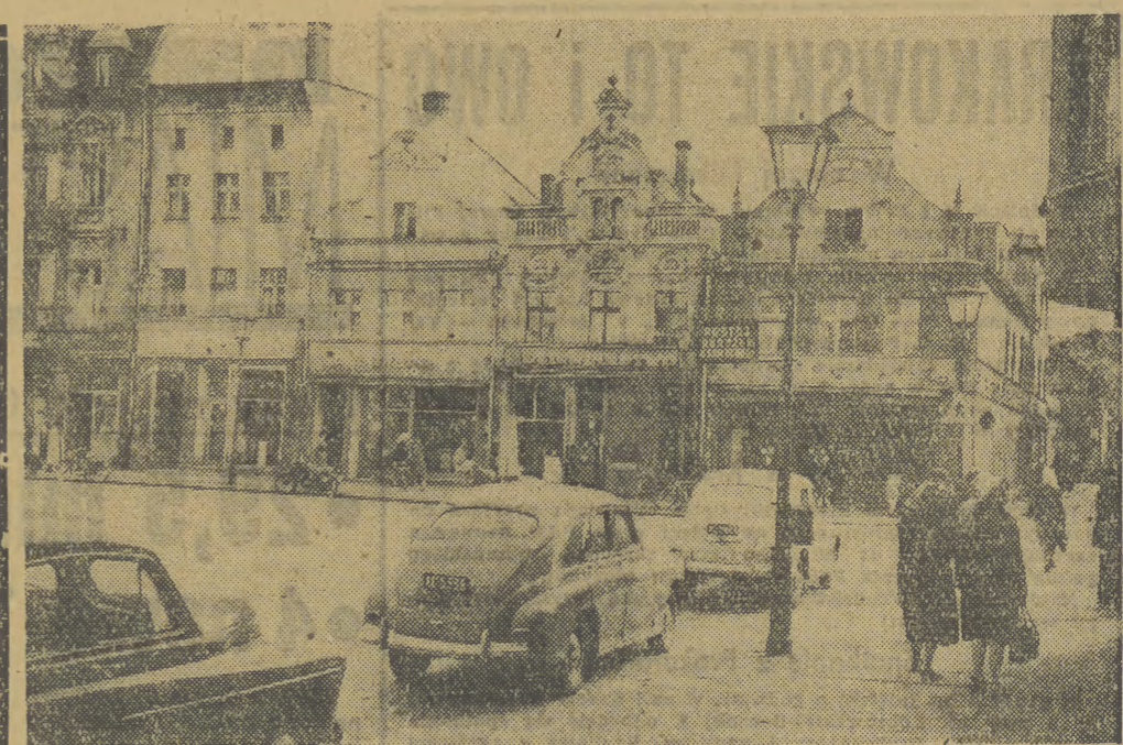
Z wędrowek po kraju. Na zdjęciu: Na rynku w Lublinie.

Do tej kwestii wrócimy w następnych numerach w najbliższym czasie. — Red.