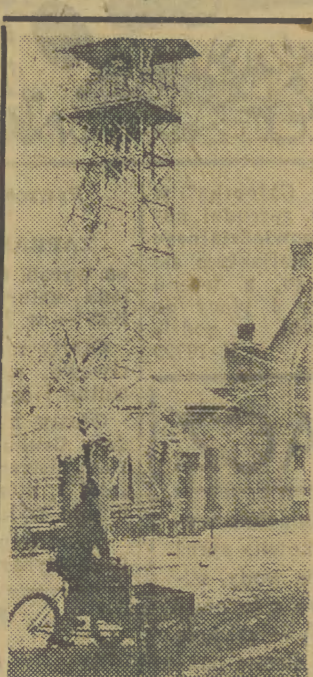
Bochnia. Nieczynny szyb kopalni soli w złomowej szalce.

przez realizację odpowiednich inwestycji. O sprawy cybernetyki zachęca w artykule pt. „Plan, rachunek i cybernetyka w życiu gospodarczym” — Seweryn Zurawicki, a Eugeniusz Garbacił pisze o ekonomicznych i technicznych przemianach w rolnictwie duńskim. Nowy zeszyt „Problemy Ekonomiczne” uzupełniają recenzja Witolda Krzyżanowskiego z książki Waltera Isarda „Methods of Regional Analysis”. (Jędrz.)