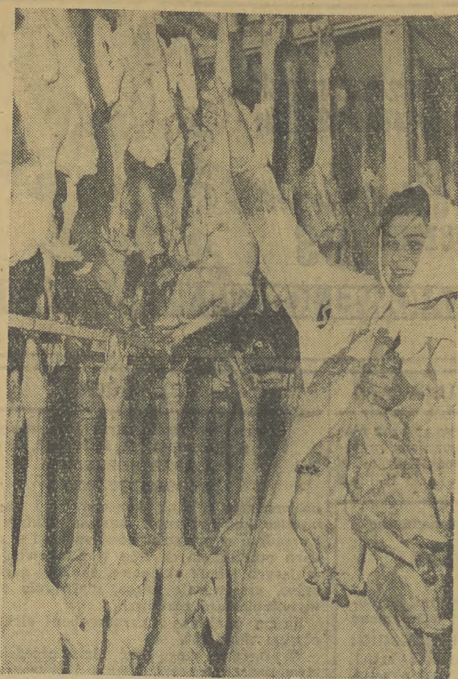
Przedświąteczny ruch panuje w Przedsiębiorstwie Jajczarsko-Drobiarskim w Barczewie (woj. olsztyńskie). Przygotowuje się tu setki ton gęsi, kaczek, indyków na rynek krajowy oraz na eksport.