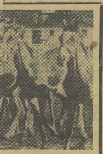
Przykazania dla zmotoryzowanych

Istnieje nawet pewien gatunek anonsów, dość często zresztą ku szczęściu mojej radości spotykany gatunek, do którego podchodzę już w sposób zdecydowanie emocjonalny. Wszystkie wymienione dotąd, a wyrażające czyjąś nadzieję na małżeństwo, na zysk, na zwrot szkolnej legitymacji, traktuję czasem z pozycji obserwatora. Dziennikarz nawet we własnym domu nie przestaje być dziennikarzem: niejeńdony dobry, ba, sensacyjny temat sprzedawo niewinne pozornie ogłoszenie... Ale ten „mój” gatunek anonsów, sensacji w żadnym razie nie zawiera. Jest bardzo jednoznaczny, dla niektórych nawet zabawny, przy innych wręcz wyśmiewany. A mnie on wzrusza. I nabieram dużej sympatii do nieznanych mi ludzi, którzy nie żalowali pieniędzy, by oznajmić wielkiemu miastu za pośrednictwem gazety, że „suczka mała, czarna, stara, kundel, zaginęła. Dla łaskawego znalazcy nagroda”. Lub też, bury kogur wyszedł z domu i dotychczas nie wrócił. Kto wie coś o jego losie, proszony jest łaskawie o zawiadomienie...”