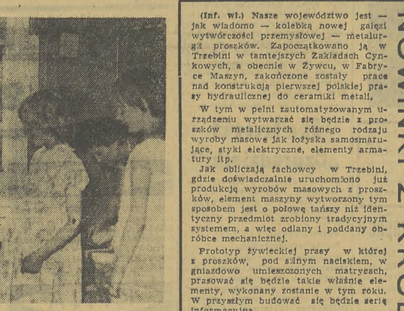
(Inf. Wł.) Nasze województwo jest — jak wiadomo — kolebką nowej gałęzi wytwórczości przemysłowej — metalurgii proszków. Zapoczątkowano ją w Trzebinii w tamtejszych Zakładach Cynkowych, a obecnie w Zywcu, w Fabryce Maszyn, zakończone zostały prace nad konstrukcją pierwszej polskiej prasy hydraulicznej do ceramiki metalu.

W tym w pełni zautomatyzowanym urządzeniu wytwarzane są proszki z metali i stopów różnego rodzaju wyroby masowe jak łożyska samosmarujące, styki elektryczne, elementy armatury itp.