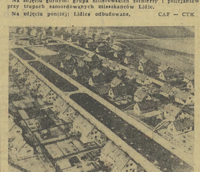
25 rocznica zbrodni w Lidicach

Giewoncie. Na szczęście z wycieczką znajdował się doświadczony przewodnik górski, który zdołał doprowadzić dzieci do schroniska na Hali Kondratowej.