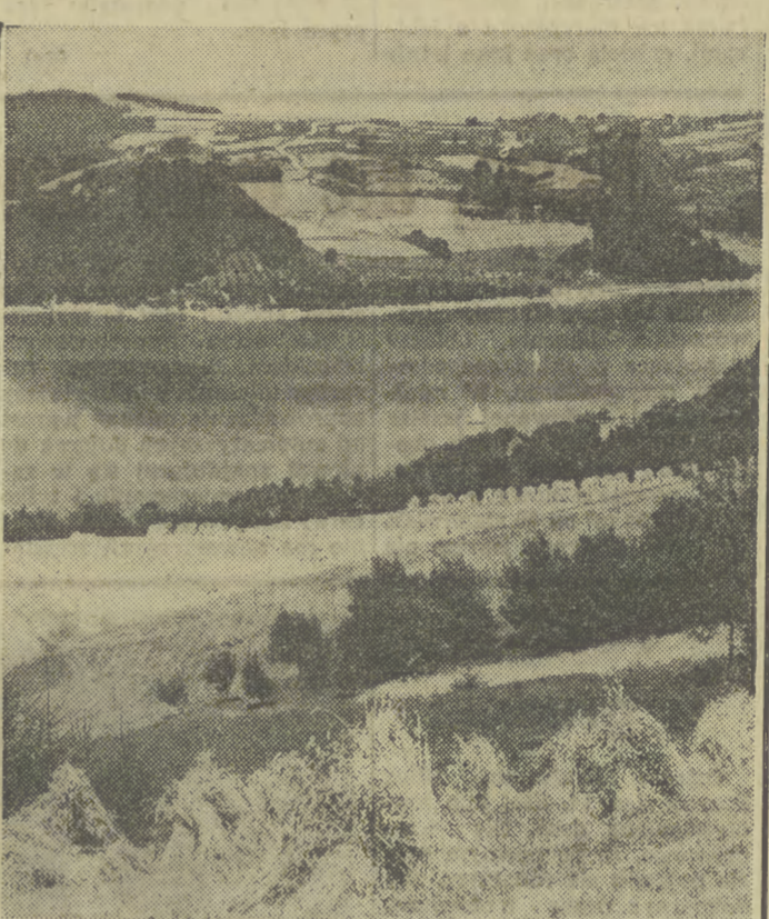
Letni pejzaż nad Jeziora Rożnowskiego