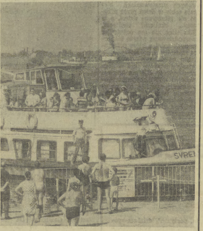
W słoneczne dni ubiegłego tygodnia warszawiacy wypoczywali nad Zalewem Zegrzyńskim