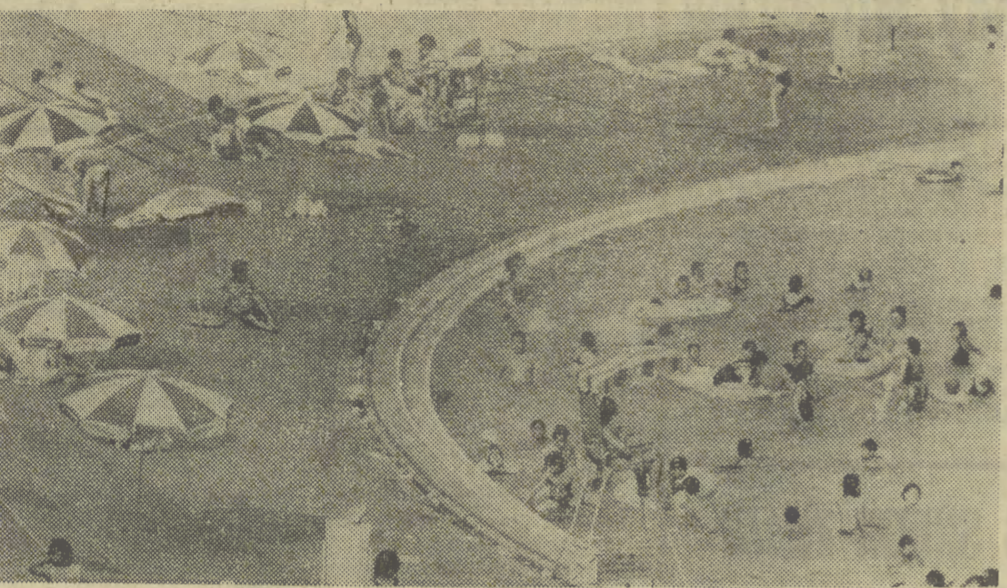
Zamiast trawy — beton. W Tokio przerobiono teren zawodów rowerowych — torowych na basen i plażę. Parasołe są wprawdzie ładne, ale pod nogami betonowa bieżnia. W sezonie kolarskim odbywać się tu będą nadal zawody.

Tarnowski Okręg Przemysłowy w pełni lata