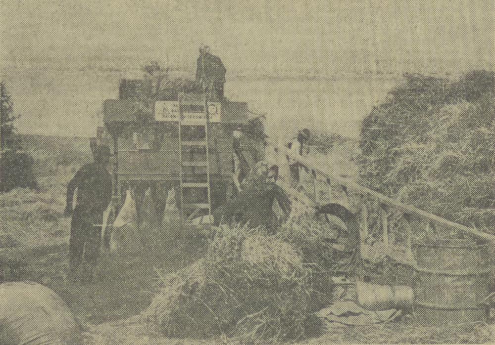
Rolnicy z Zabierzowa młócą zboże na jednym z dwóch kłospisk zorganizowanych przez Kółko Rolnicze.

12.329 książeczek z pełnymi przedpłatami, z których 3.947 zostało uzupełnionych do 30 czerwca br. a 8.382 — do 10 sierpnia br. 300 spośród wylosowanych w kraju samochodów będzie do odebrania w oddziałach „Behamot-Polmo” do końca III kwartału br., pozostałych 200 natomiast — w ciągu IV kwartału br. Kolejne losowanie 2 tys. polskich fiatów 126 p — z terminem dostawy w 1974 r. — odbędzie się w połowie października br. Wezmą w nim udział książeczki z pełnymi wpłatami za samochody, zadeklarowane do nabycia w 1977 r. oraz te, których właściciele uzupełniają wkład do pełnej wysokości w terminie do 30 września br.