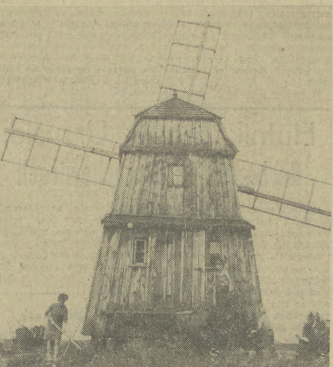
Skansen koło Olszyna wzbogacił się o nowy interesujący obiekt. Jest nim XIX-wieczny wiatrak pochodzący z okolic Krolewca.

W wyniku opracowania przez poznański ośrodek skutecznych środków walki z zatruciem grzybami, liczba wypadków śmiertelnych poważnie zmalała. Niemniej jednak nadal ok. 12 proc. spośród lekkoomyślnych amatorów grzybobrania — stanowią ofiary śmiertelne.